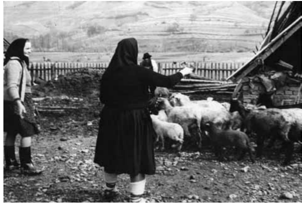
Scoaterea oilor din poiată