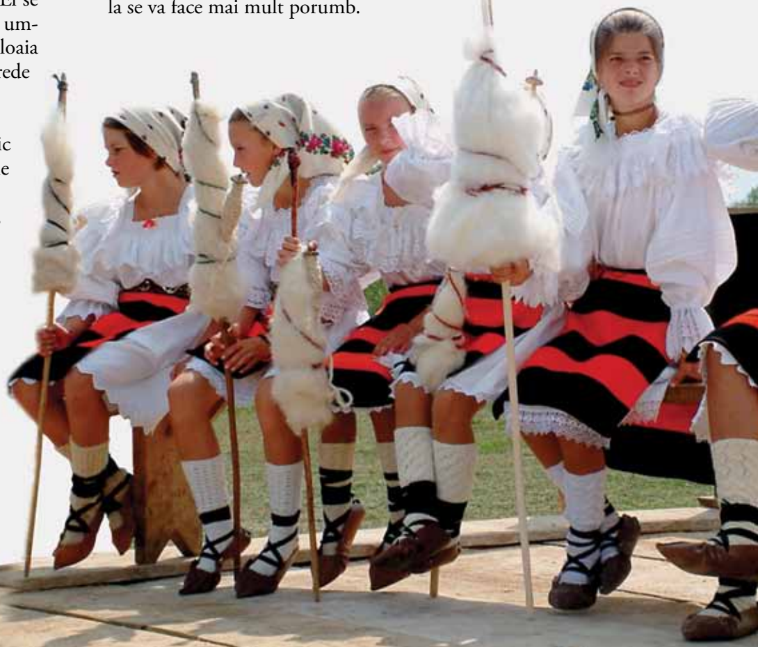
Festivalul Roza Rozalina din Rozavlea poartă numele fetei uriașului Cingălău

Pe vremuri, bătrânii se uitau la culorile curcubeului și, în funcție de culoarea care era mai pregnantă știau ce va rodi mai bine în anul respectiv. Dacă era mai mult verde, ziceau că va fi iarbă multă, de era galben, că va fi grâu mult, iar de era mai mult roșu, că în anul acela se va face mai mult porumb.