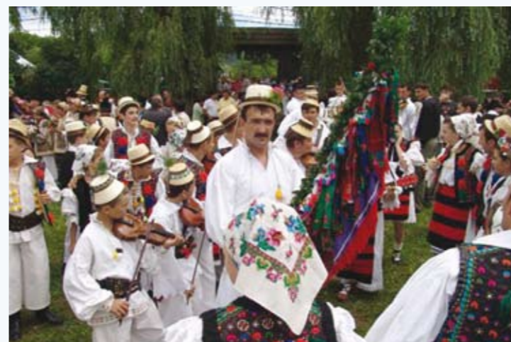
Festivalul Nunților din Vadu Izei