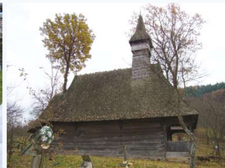
Biserica de lemn de la Valea Stejarului