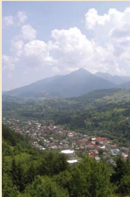
În apropierea eliberării, 13-14 octombrie 1944, autoritățile fasciste de ocupație au organizat adevărate masacre. Masacrul de Moisei este însă unul dintre cele mai sângeroase.