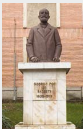
Municipiul Zalău , județul Sălaj în fața Arhivelor Naționale