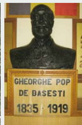
Orașul Cehu Silvaniei , județul Sălaj, în incinta Grupului Școlar