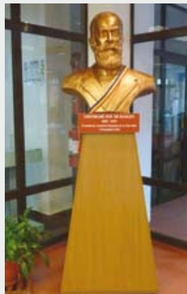
Municipiul Baia Mare , în incinta Bibliotecii Județene "Petre Dulfu"