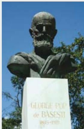
Comuna Băița de sub Codru , județul Maramureș, în curtea bisericii