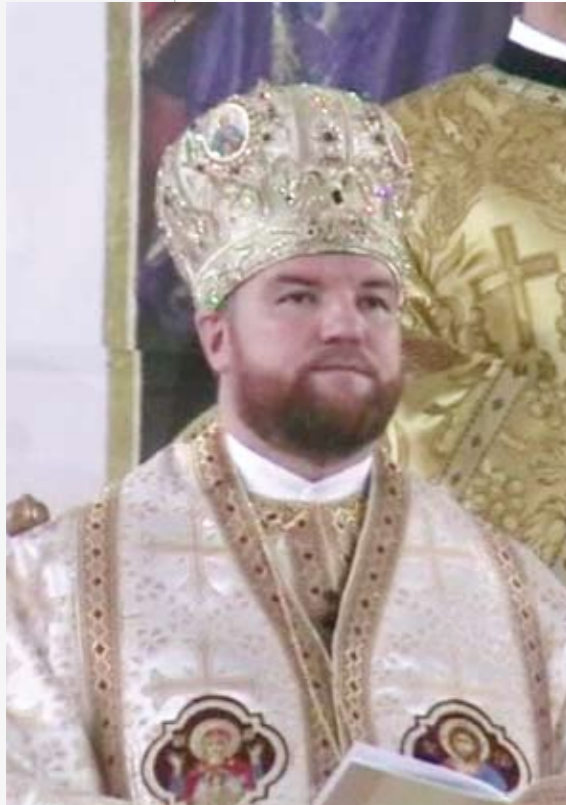
† Vasile Bizău, Episcopul Eparhiei de Maramureș a Bisericii Române Unită cu Roma, Greco- Catholică

În viața unei instituții, ca și în viața personală a fiecărui om, momentele semnificative sunt cele care creionează fizionomia spirituală și chipul concret al prezenței în timp a respectivei instituții. De asemenea, o instituție este însuflețită de oamenii care în ea își desfășoară activitatea și este particularizată în valorile sale de conducătorii ei. Virtuțile și calitățile sufletești ale domnului Inspector Șef Colonel Ion Pop așa cum le cunoaștem – generozitatea, spiritul de luptător și omenia –, ne îndreptățesc să așternem câteva rânduri. Momentul festiv al inaugurării busturilor celor doi mari reprezentanți ai luptei pentru realizarea unității naționale, George Pop de Băsești și eroul din Dealul Spirii, Cpt. Pavel Zăgănescu, ne oferă prilejul de a face câteva considerații pe marginea rolului jucat de instituția dumneavoastră în viața cetății și a întregului județ.