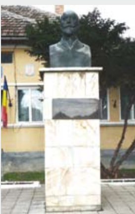
Comuna Băsești , județul Maramureș, în fața Primăriei