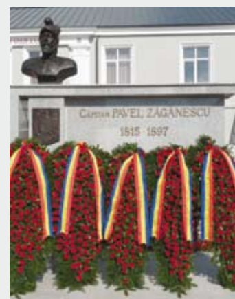
Municipiul Baia Mare , județul Maramureș, în fața Detașamentului de Pompieri „Cpt. Marchiș Adrian” din localitate