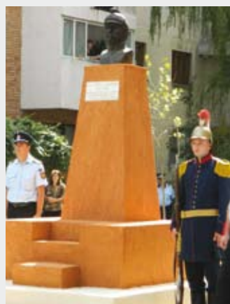
Municipiul Râmnicu Sărat , județul Buzău, în fața Detașamentului de Pompieri din localitate