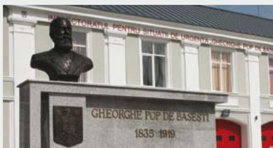
Municipiul Baia Mare , în fața sediului I.S.U. Maramureș