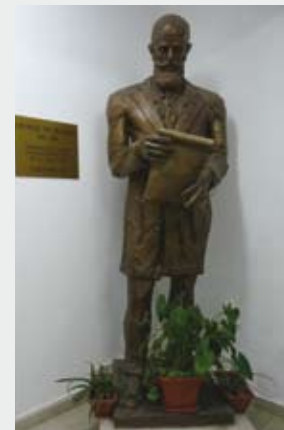
Municipiul Baia Mare , în incinta I.S.U. Maramureș