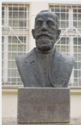
Municipiul Alba Iulia , în fața Muzeului Unirii