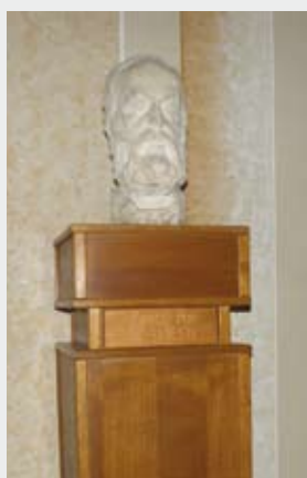
Municipiul Zalău , județul Sălaj, în sediul Primăriei Municipiului