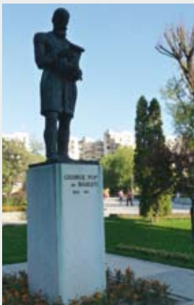
Municipiul Baia Mare , județul Maramureș în Parcul Mara