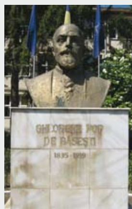
Orașul Cehu Silvaniei , județul Sălaj, în fața Grupului Școlar