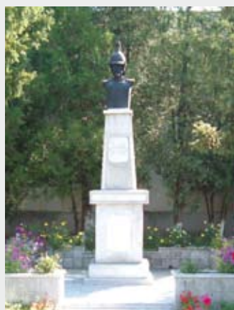
Orașul Boldești , județul Prahova, în fața Școlii de Subofițeri de Pompieri și Protecție Civilă „Pavel Zăgănescu”