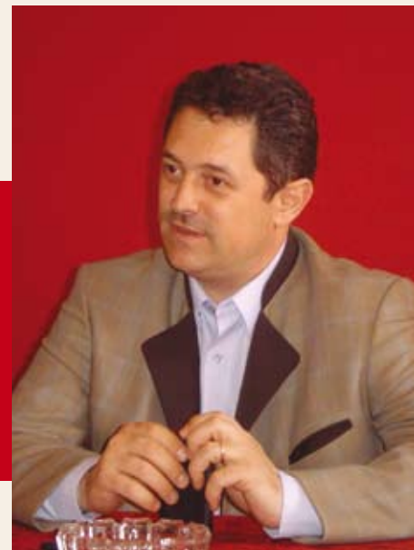
Marius Sorin Bota, senator

Cu această ocazie, a fost adoptată o declarație care avea ca obiectiv atragerea atenției comunității locale și centrale privind efectele aplicării tehnologiilor poluante, declarația având susținerea prin semnătură a mii de maramureșeni. De fapt, mesajul din demersurile arătate mai sus este unul simplu, acela de a „zgândări” conștiința umană până se va înțelege că avem o responsabilitate față de natură. Mă întreb dacă mesajul meu a ajuns acolo unde trebuie! Atunci când l-am văzut pe „unul din marii județului” vărsându-și năduful pe inițiativa mea, pe mine, simțindu-se deranjat că doream ca demersul meu să ajungă la unele foruri din minister, am înțeles că încă există cauze și interese ascunse înțelegerii omului