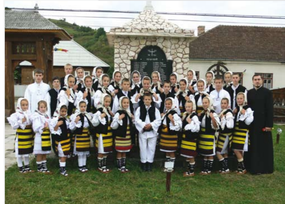
Corul din Ieud