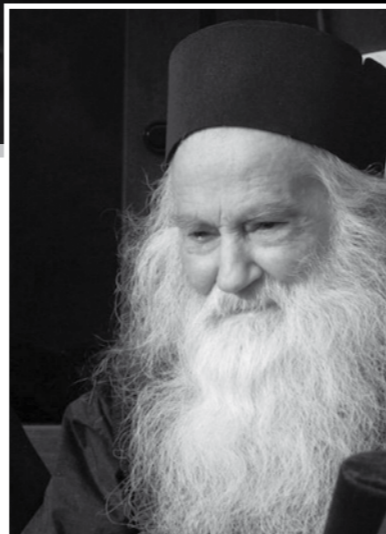
Părintele Iustin Părvu

Obligați să muncească chiar și de marele praznic al Învierii Domnului, deținuții de la mina Baia Sprie au reușit să aducă lumina în adâncuri, printr-o slujbă religioasă care le-a mișcat sufletele până la lacrimi.