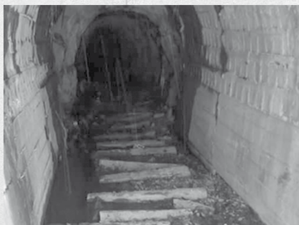
Intrare în mina Nistru

„Fiecare zi de muncă este un pas către libertate”. Aceasta era promisiunea mai marilor comuniști în 1951, când primele grupuri de deținuți slăbiți, bolnavi și înfomețați de la Aiud au fost trimiși spre minele de plumb și cupru din Maramureș. De fapt, era numai un pas spre moarte. O moarte pe care unii și-au găsit-o ușor, înghițiți de valurile de pământ, iar alții lent, prin boală și mizerie.