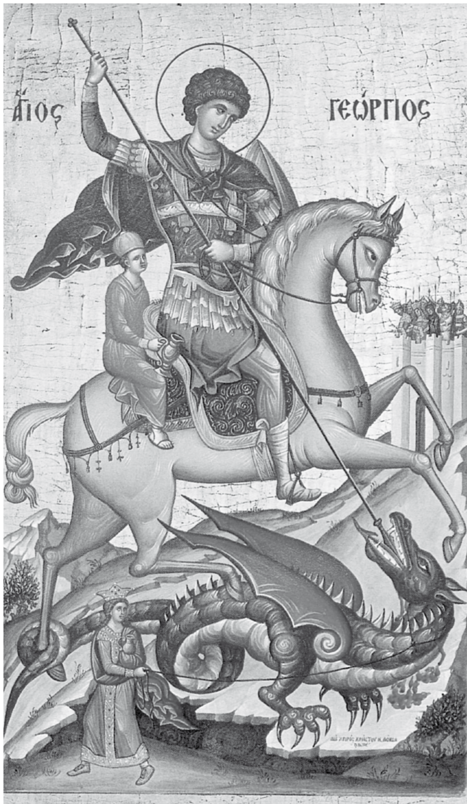
Legenda potrivit căreia sfântul ar fi ucis un balaur pentru a salva o fecioară este o invenție târzie, medievală. Adesea însă, iconografia recentă ni-l prezintă pe sfânt călare, doborând cu sulița un balaur, poate simbolic.

Sfântul Gheorghe a fost ispitit cu onoruri pentru a jerfi zeilor, dar aceste încercări au fost zadarnice. Pentru că nu a lepădat credința în Hristos, Sfântul Gheorghe este condamnat la moarte prin decapitare, în ziua de 23 aprilie 304, rămânând de atunci zi de prăznuire.