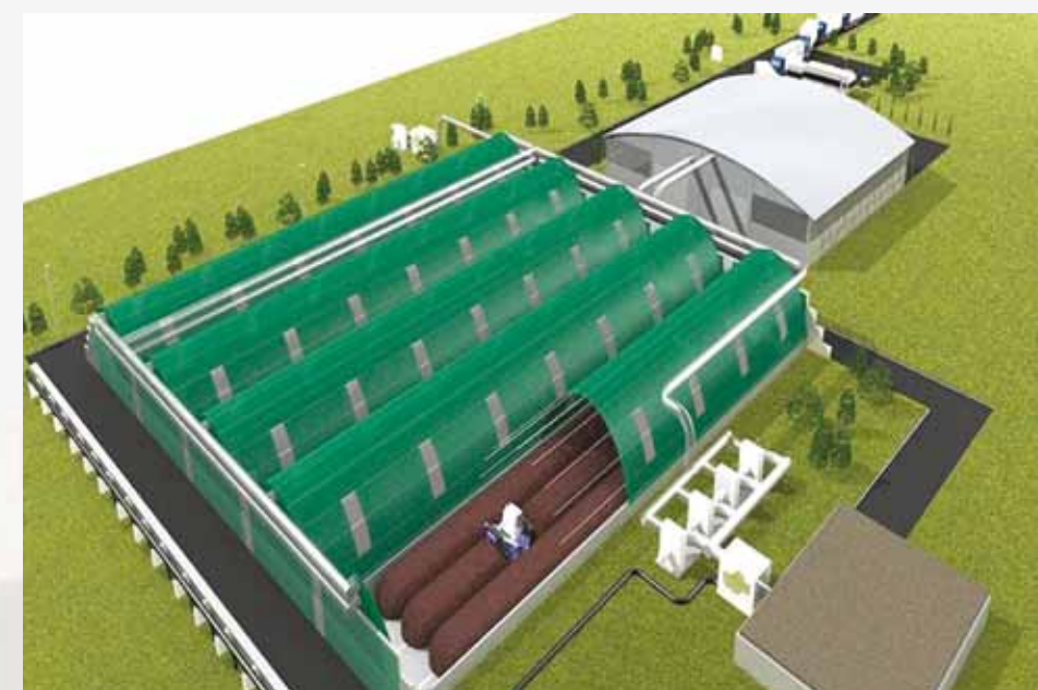
Proiectul „Sistem de management integrat al deșeurilor în județul Maramureș” este în faza de execuție fizică a lucrărilor. Contractul de Finanțare a Proiectului a fost semnat în data de 10 februarie 2014, între Ministerul Mediului și Schimbărilor Climatice, în calitate de Autoritate de Management pentru Programul Operațional Sectorial „Mediu” și Consiliul Județean Maramureș, în calitate de Beneficiar

S-au început lucrările la construirea a cinci puncte de colectare a deșeurilor voluminoase la Baia Mare, Seini, Borșa, Șomcuta Mare, Vișeu de Sus și în cel mai scurt timp vor începe lucrările și la închiderea în sit a depozitelor de deșeuri neconforme urbane la Vișeu de Sus, Teplîța-Sighetu Marmăției și Satu Nou-Baia Mare, respectiv proiectare și execuție pentru trei relocări la Seini, Târgu Lăpuș, Ariniș-Borșa.