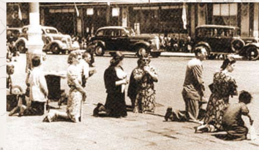
28-iunie-1940-București. Zi de doliu național, răpirea Basarabiei

motiv că tatăl lor ar fi fost primar. De fapt, era vorba de fratele tatălui lor. Pentru o încurcătură, au stat 20 de ani în Siberia. În sfârșit, au fost reabilitați și lăsați să plece acasă, dar aici au constatat că nu mai aveau nimic. Fiul mijlociu s-a întors de bună voie în Siberia, de această dată ca om liber, unde a muncit doi ani pentru ca familia să-și răscumpere propria casă. După exact douăzeci de ani, în aceeași zi și aceeași lună în care au fost deportați, au reintrat în casa natală.