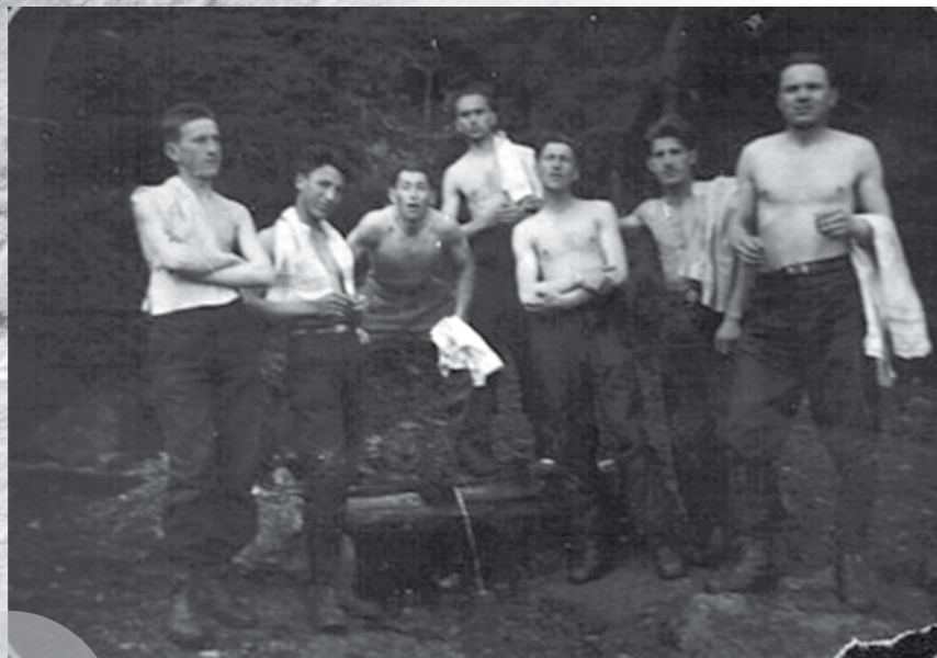
Grupul Ion Gavrilă Ogoranu

În epoca trădării și lașității, un grup de tineri a decis să spele, cu prețul propriei vieți, obrazul și demnitatea țării. Astăzi, povestea lor pare desprinsă dintr-un film de acțiune. E însă dovada curajului și credinței animate, demult, de un motto, scris de un om excepțional pe o carte de rugăciuni: „Brazilii se frâng, dar nu se îndoiesc”.