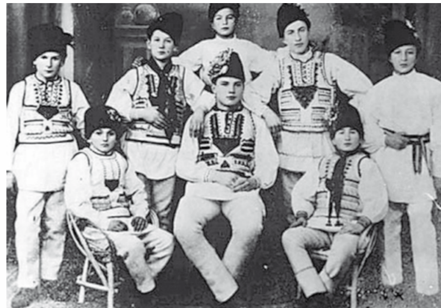
Frăția de cruce Negoiful - Liceul Negru Vodă