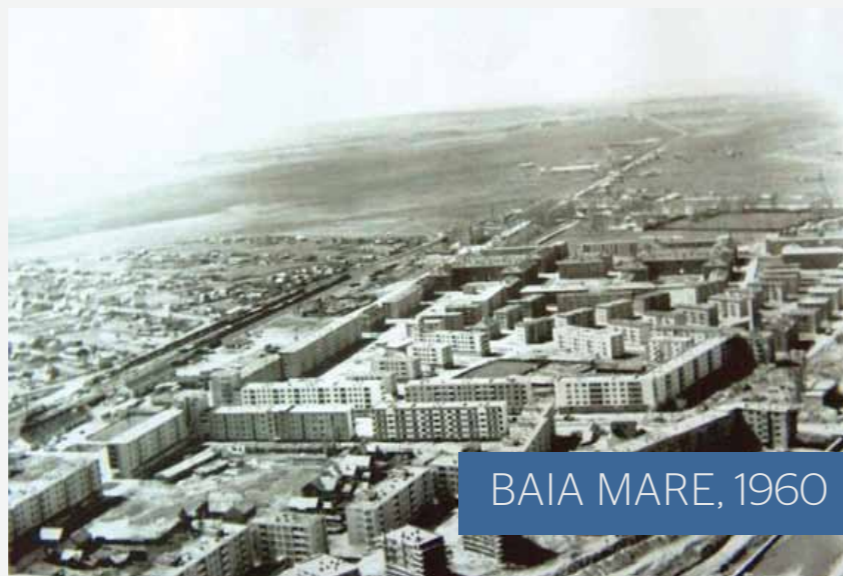
BAIA MARE, 1960