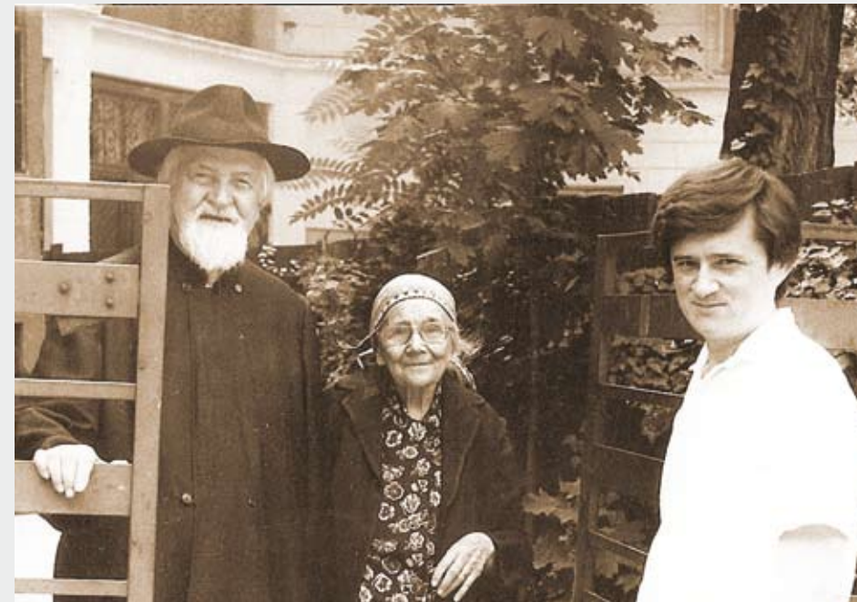
Dumitru Stăniloae cu soția și pictorul Horea Paștina

Părintele Stăniloae își recapătă catedra și se pune pe treabă. Din 1976 până în 1980 apar cinci volume noi din Filocalie cu introduceri și note care degajă permanența și actualitatea acestui drum.