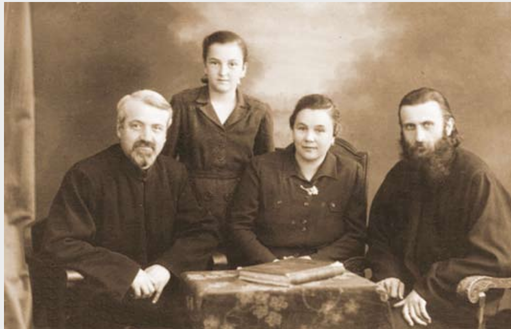
Familia Stăniloae și părintele Arsenie Boca