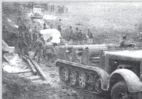
Tractor Famo ajutând la remorcarea vehiculelor împotmolite. Transilvania, septembrie 1944.