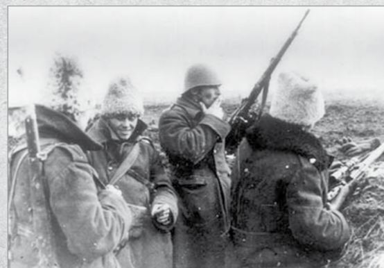
Ostași în tranșee la Cotul Donului, octombrie 1942

și fiecare se folosește de modestul săculeț de merinde, iar cei din mediul sătesc scot ploscuța de țuică, trecând-o de la unul la altul, după care plutonul de luptători pornește în flanc de câte unul-fără zgomot-la poalele Gutinului. Este ora 20.30. Urcușul este tot mai greu. Dăm însă peste o zonă cu boscheți la o distanță de circa 38 m de obiectiv. (...) Este ora 4. La înălțimea muntelui se mijeste de ziua. În liniștea deplină, ne apropiem târâș la 15-16 m de obiectiv. Planul se realizează pas cu pas, așa cum fusese stabilit. Este ora 6.30. O dimineață frumoasă, însoțită de toamnă, dar în cadrul obiectivului inamic nu se observă nicio mișcare. (...)