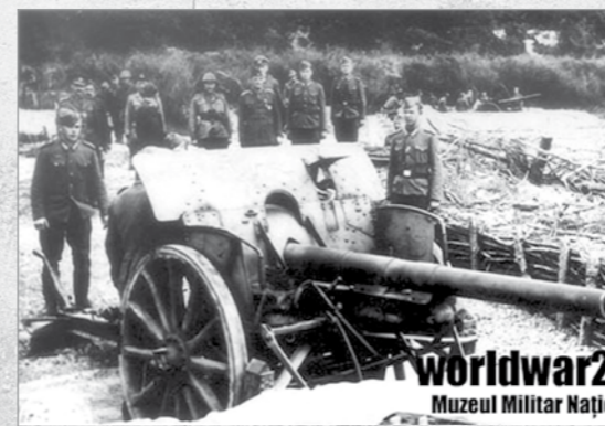
Generalul Pantazi inspectează poziții de artilerie pe frontul de est

„Vă cerem să depuneți tot armamentul cu care sunteți dotați și veți fi ajutați de către partizani să vă procurați haine civile și cele necesare până la hotarele unde doriți să mergeți. Vă dăm timp de gândire 30 de minute. Vreți libertate sau vărsare de sânge”.