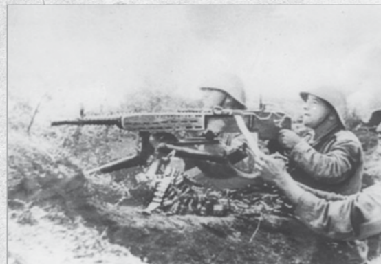
Servanți executând foc cu mitraliera ZB-53. Transilvania, octombrie 1944