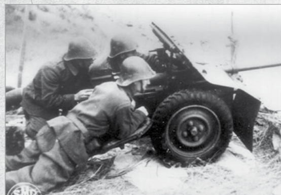
Tun anticar Bofors al trupelor de cavalerie. Capul de pod Taman, mai 1943.

Este ora 7.30. Apar trei militari inamici înarmați, și anume doi soldați și un sergent. Ei vin spre noi, fără să ne observe. Îi lăsăm să se apropie la distanța de 8-10 m, când i-am somat. Ei s-au oprit. Atunci i-am întrebat, în limba maghiară, dacă fac parte din bateria respectivă. Ni s-a răspuns: „da, fac parte din efectiv”. Îi somez să depună armele și să comunice comandamentului de baterie să vină până la noi pentru unele informații. Ne-au răspuns că sunt de acord să-l anunțe, dar nu sunt de acord să depună armele. Le-am explicat pericolul în care se află, fiind încercuți și faptul că noi am venit să-i eliberăm și astfel să poată scăpa cu viață și să ajungă la casele lor. Atunci au înțeles și au depus armele, după care au plecat la comandantul lor. Am așteptat. După 40 de minute a apărut comandantul în fruntea a 21 ostași, 2 ofițeri, 2 subofițeri, 2 adjutanți plutonieri majori cu care se apropia de noi. La distanța de 10 m i-am