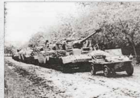
Coloană de blindeț în Transilvania