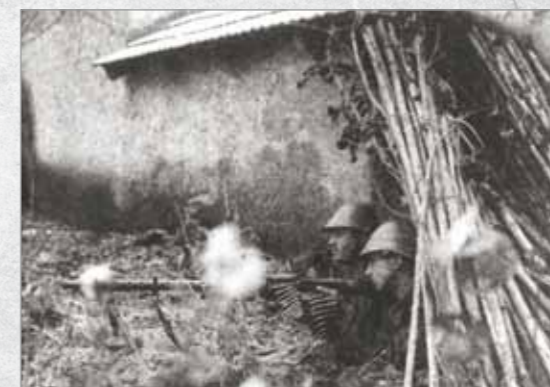
Cuib de mitralieră MG-34