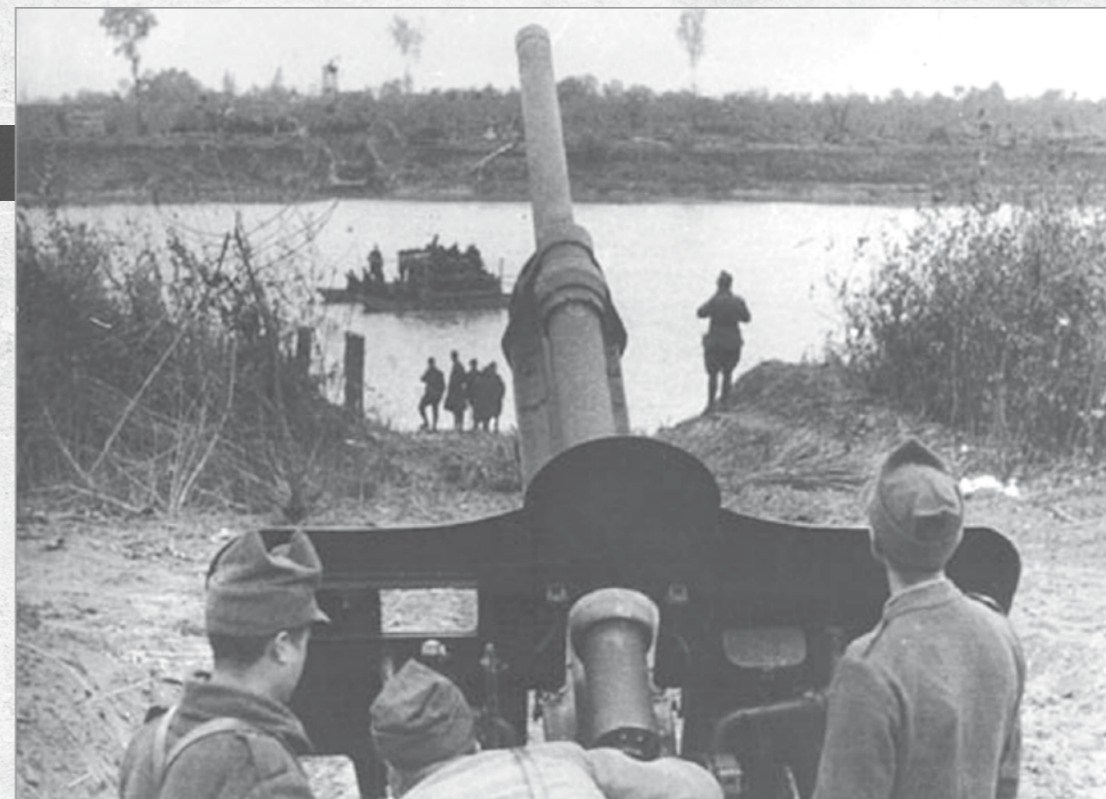
Tun calibrul 76,2 mm (capturat în timpul campaniei din est) sprijină cu foc traversarea Tisei