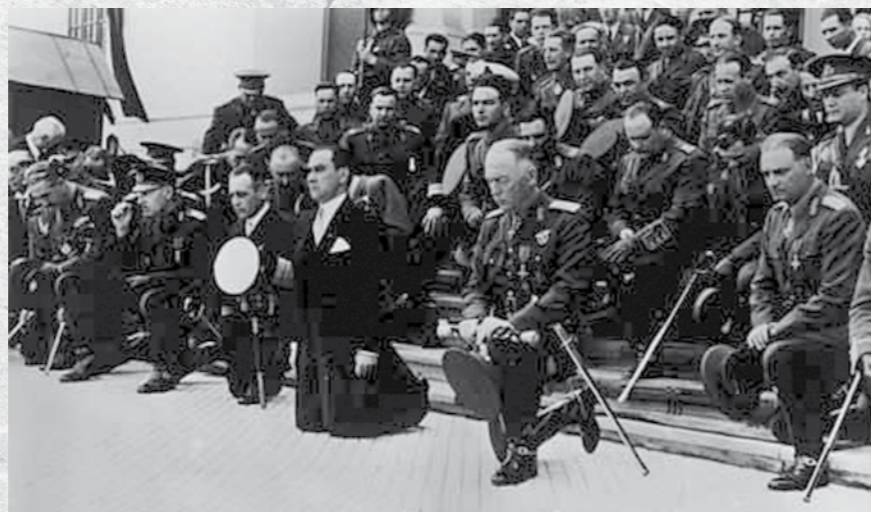
Generalul Ion Antonescu, împreună cu Mihai Antonescu (stânga) și ofițeri, în timpul unei slujbe religioase

„Am rezistat și următoarele luni, iar la sfârșitul lui martie, ne-am retras pentru refacere, între orașele Kertsch și Feodosia, ajungând apoi la Simferopol și Sevastopol. Din urmă am fost ajunși de alte coloane, disperate, de la care am aflat că trupele sovietice au debarcat pe litoralul Mării de Azov și că au rupt frontul la gâtul Perekop, încercuit astfel trupele române și germane aflate în Peninsula Kertsch, pe care le-au făcut prizoniere. Deci noi eram ultimele trupe care am scăpat din