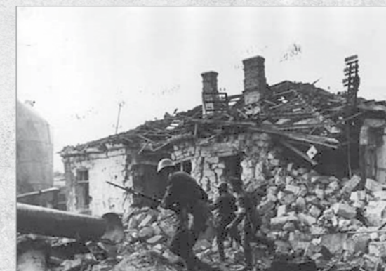
Soldati români în timpul bătăliei de la Odessa