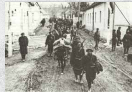
Vânători de munte în Cehoslovacia în aprilie 1945. Soldații poartă băștile caracteristice armeei