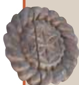
Tânjaua de pe Mara

Bănățeanu Tancred, Portul popular din regiunea Maramureș Oaș, Maramureș, Lăpuș , ed. de Casa Creației Populare, Baia Mare, 1965.