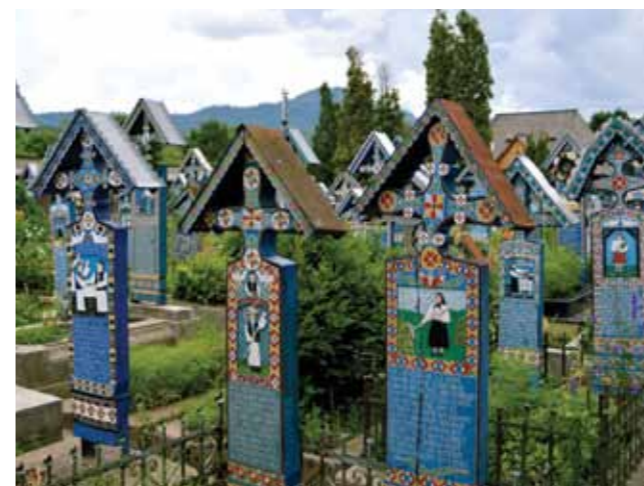
Cimitirul Vesel din Săpânța