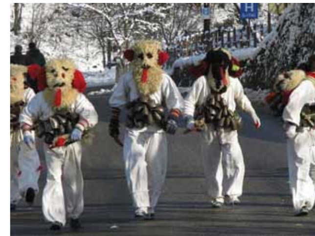
Bondroși in Cavnic

La Institutul de Lingvistică și Istorie Literară din Cluj, se păstrează un document care prezintă importanță din punct de vedere al istoriei folcloristicii maramureșene. Este vorba de un manuscris datat 30 noiembrie 1814, descoperit în localitatea Șieu și care cuprinde 60 de „versuri” amprentate de „numeroase elemente folclorice și crâmpie de veritabilă poezie populară”.