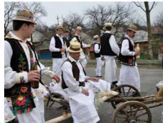
Udătoriul din Șurdești