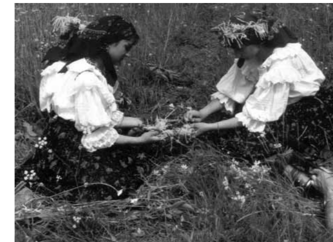
De Sânzienă, în Maramureș