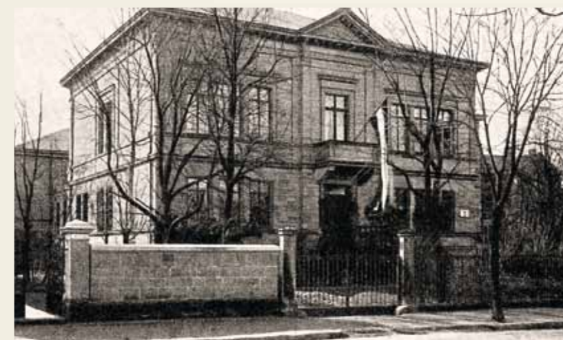
Institutului de Cercetări de Chimie, Fizică și Electrochimie din Göttingen