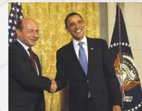
2012. Traian Băsescu și Barack Obama

Pentru români, SUA a reprezentat întotdeauna speranța și „Pământul făgăduinței”. Oficial, România și Statele Unite au relații diplomatice de 133 de ani. Românii obișnuiți au simțit însă cu adevărat suflul american abia după Revoluția din 1989.