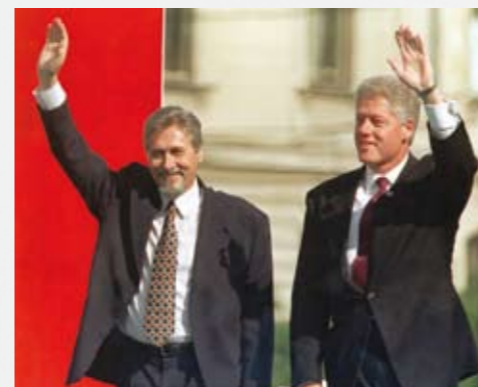
1997. Emil Constantinescu și Bill Clinton

Cu vânzări de 16,4 bilioane $ în 2012, TRW Automotive se clasează printre cei mai importanți furnizori de automotive. Cu sediul în Livonia, Michigan, Statele Unite ale Americii, Compania, prin intermediul filialelor sale, operează în 25 de țări și are aproximativ 65.000 de angajați în întreaga lume. TRW Automotive Products include sisteme integrate pentru controlul autovehiculului și sisteme de asistență pentru conducătorul auto, sisteme de frânare, sisteme de direcție, sisteme de suspensie, sisteme de siguranță pentru ocupanți (centurile de siguranță și airbag-uri), electronice, componente de motoare, sisteme de fixare și piese pe piața pieselor de schimb și servicii.