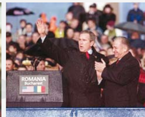
2002. George W. Bush și Ion Iliescu