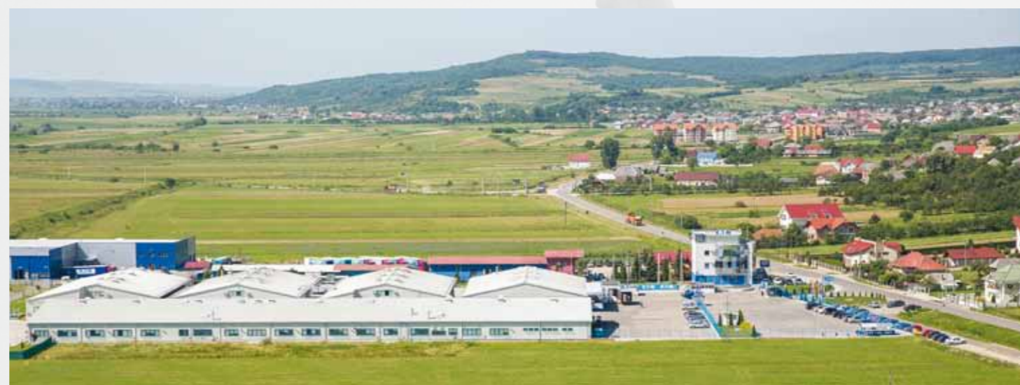
Fabrica EATON din Sîrbi, Maramureș