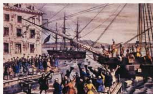
Partida de Ceai de la Boston