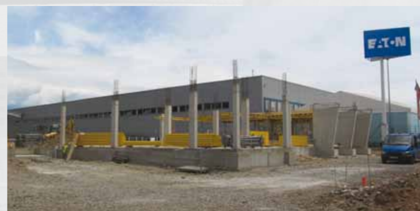
Fabrica EATON din Bușag, Maramureș

Pentru mai multe informații, vă rugăm să accesați www.eaton.com . Pentru cele mai recente noutăți, puteți să ne urmăriți și pe Twitter (@Eaton_EMEA) sau LinkedIn (Eaton EMEA).