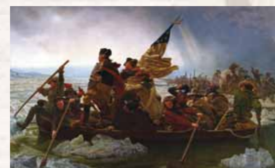
Washington trecând râul Delaware

trei vase din portul Boston și au aruncat în apele oceanului încărcătura de ceai. În consecință, portul Boston a fost închis de englezi, iar populația, obligată la întreținerea trupelor engleze și plățirea ceaiului. De această dată, reacția coloniștilor a fost mai fermă.