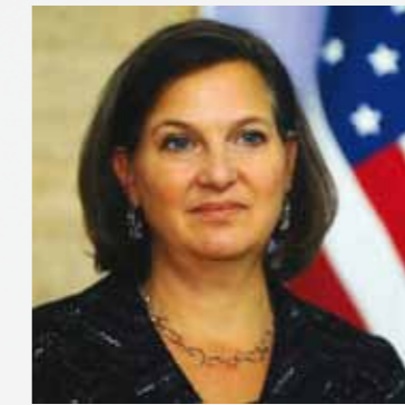
Mesajul Adjunctului Secretarului de Stat pentru Europa și Eurasia, Victoria Nuland, cu privire la parteneriatul SUA - Romania

La 13 septembrie 2011, la Washington DC, a fost adoptată Declarația Comună privind Parteneriatul Strategic pentru Secolul XXI între România și Statele Unite ale Americii. Declarația confirmă Parteneriatul excelent, pe termen lung și în continuă dezvoltare, dintre cele două state, și stabilește, de asemenea,