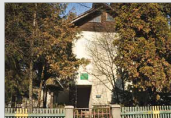
Sediul Ocolului Silvic Târgu Lăpuș

Regenerarea pădurilor se realizează pe cale naturală în cazul aplicării de tratamente care favorizează instalarea și dezvoltarea semințișului și pe cale artificială, prin plantații, semănături directe, butășiri). Lucrările de regenerare a pădurilor trebuie executate conform Codului Silvic în cel mult doi ani de la ultima tăiere. Suprafețele regenerare în fiecare an urmează dinamica suprafețelor de pe care s-a recoltat masă lemnoasă. În total, din 1990 până la finele anului trecut s-au făcut regenerări în fondul forestier de stat pe o suprafață de 23.897 hectare, dintre care 11.833 regenerări naturale, 12.064 împăduriri în fond forestier de stat și 342 împăduriri la alți deținători.