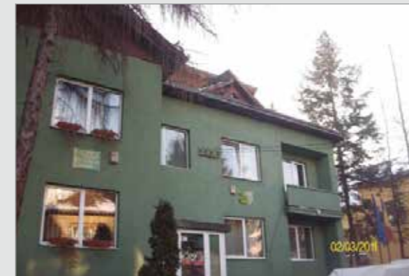
Sediul Ocolului Silvic Mara

Pentru anul trecut, era planificată o cifră de afaceri de 40 de milioane de lei, care a fost depășită însă, cu aproape cu un sfert: peste 8 milioane de lei. Iar profitul brut a fost de 2,4 milioane de lei. Anul trecut s-a planificat a se recolta 430.000 de mc de lemn din pădurile statului, dar au fost valorificate 413.000 mc, cea mai mare cantitate reprezentând-o fagul, urmat de molid și alte specii.