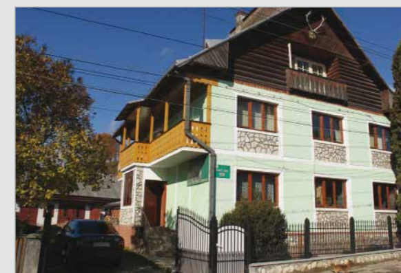
Sediul Ocolului Silvic Vișeu