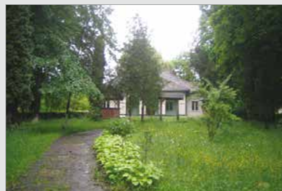
Sediul Ocolului Silvic Șomcuta