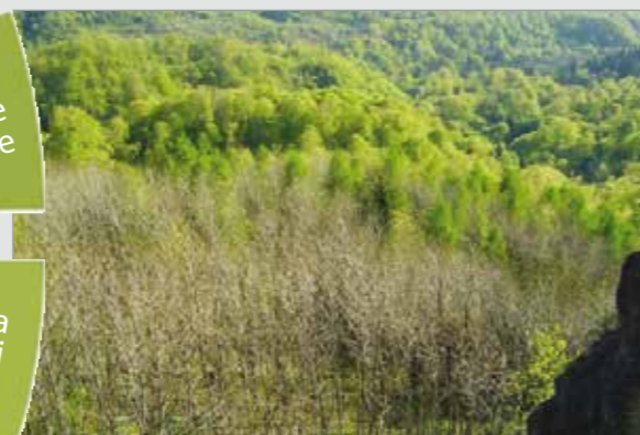
Baia Sprie: frășinet