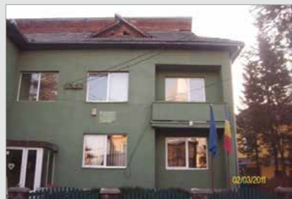
Sediul Ocolului Silvic Sighet