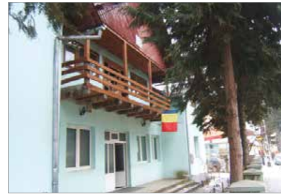
Sediul Ocolului Silvic Dragomirești