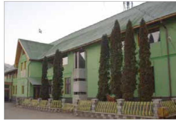
Sediul Ocolului Silvic Baia Mare

Direcția Silvică Maramureș este o instituție-etalon. O demonstrează cifrele, dar și rezultatele din teren. Toți indicatorii propuși au fost depășiți.