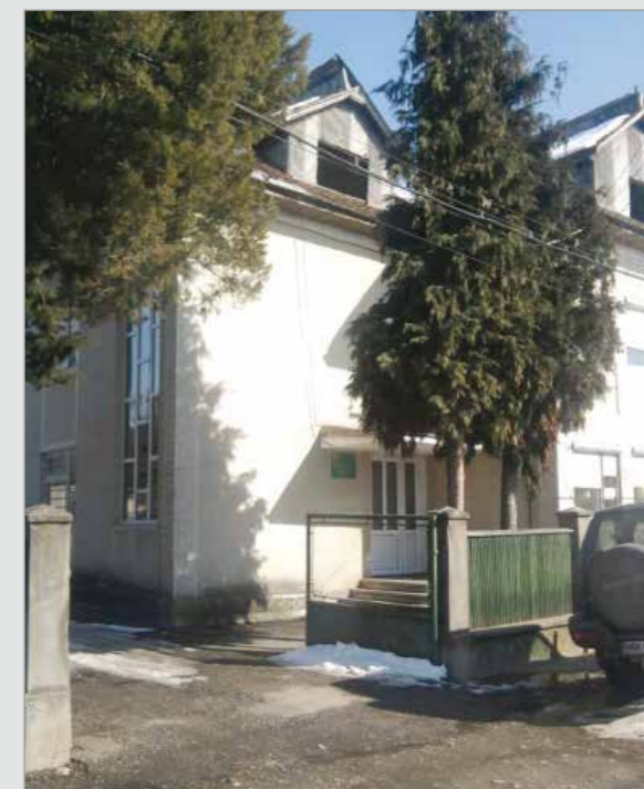
Sediul Ocolului Silvic Ulmeni