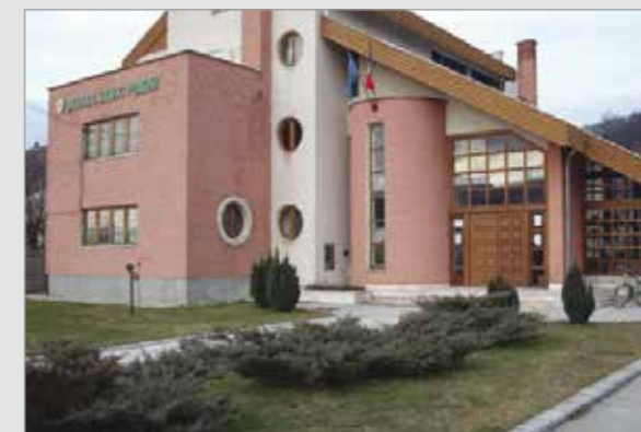
Sediul Ocolului Silvic Poieni

PROGRAMAT 2013 REALIZĂRI 2013 PROGRAMĂRI 2014