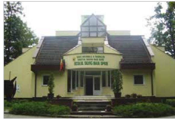
Sediul Ocolului Silvic Baia Sprie