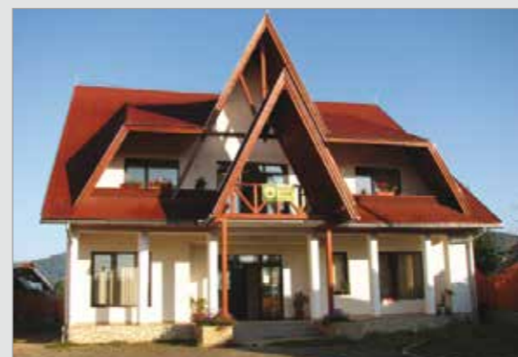
Sediul Ocolului Silvic Tăuții Măgherauș