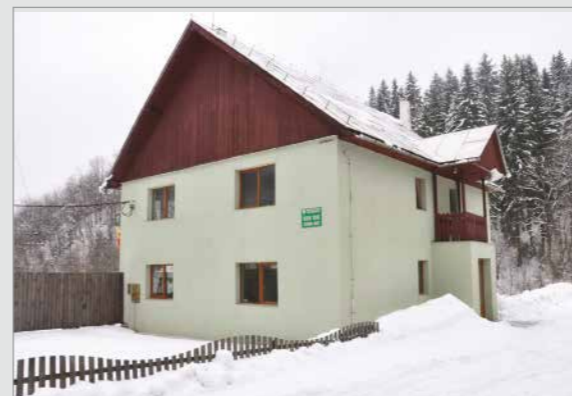
Sediul Ocolului Silvic Strâmbu Băiut