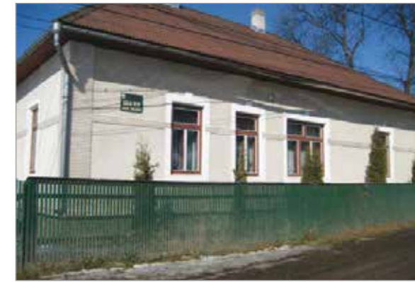
Sediul Ocolului Silvic Groșii Țibleșului

Direcția Silvică are în subordine directă 13 ocoale silvice: Firiza – 10173 hectare, Baia Sprie, 4848 hectare, Dragomirești- 10.956 hectare, Groșii Țibleșului – 10541 hectare, Mara, 12334 hectare, Poieni, 23971 hectare, Sighet, 8104 hectare, Șomcuta, 3691 hectare, Strâmbu Băiuț, 12480 hectare, Tăuți Măgherauș, 7959 hectare, Tg. Lăpuș, 80006 hectare, Ulmeni, 3657 și Vișeu, 25.152 hectare.