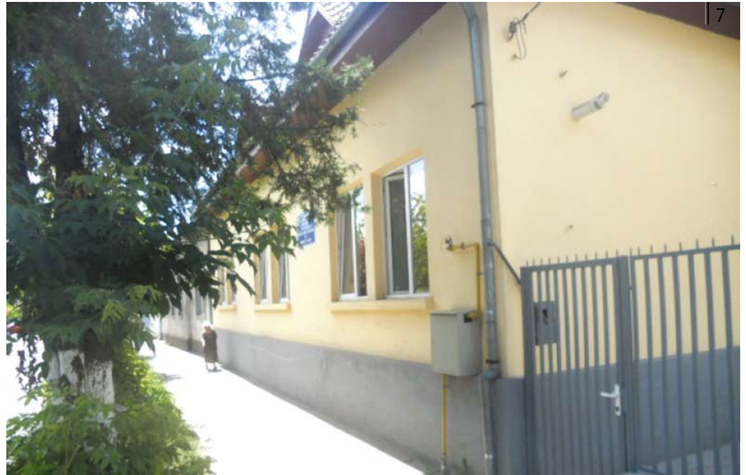
Sediul serviciului de asistență socială Sighetu Marmației

Sumele alocate pentru construirea Centrului pentru persoanele Vârstnice au fost deja aprobate de consilierii locali. Iar proiectul a primit girul Ministerului Muncii care i-a alocat și cea mai mare parte din finanțare.