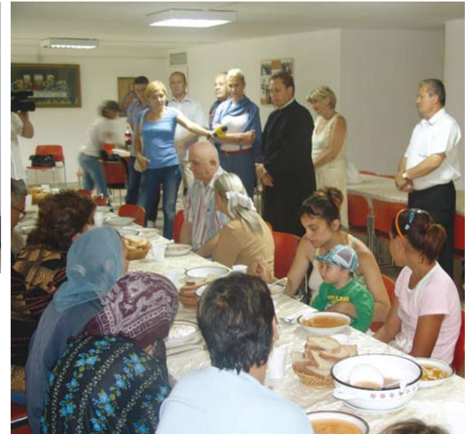
Cantina socială Sighetu Marmației

Persoanele Vârstnice, dar și un Centru de Zi pentru copii, care va funcționa și ca un after-school, copiii având la dispoziție și un psiholog sau un consilier educativ.