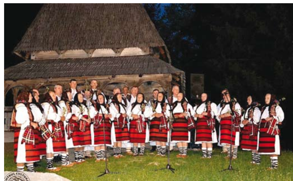
Izvorul Izei din Săcel