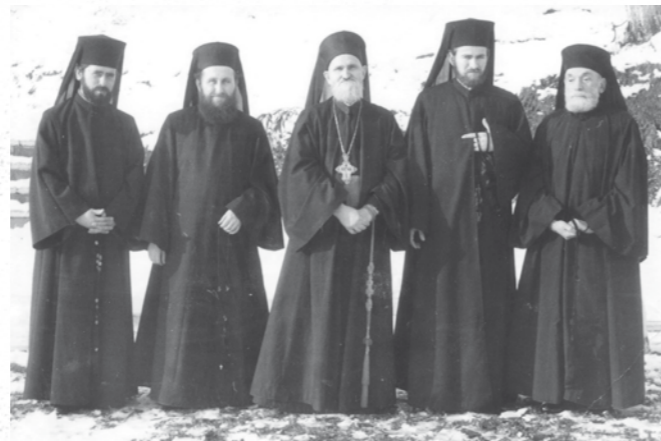
Nicolae Steinhardt și obștea de la Rohia

Acest gest simbolic are o valoare deosebită mai ales în contextul în care Sfântul Sinod al Bisericii Ortodoxe Române a hotărât ca în anul 2017 să fie comemorat Patriarhul Justinian împreună cu toți apărătorii Ortodoxiei în timpul comunismului.