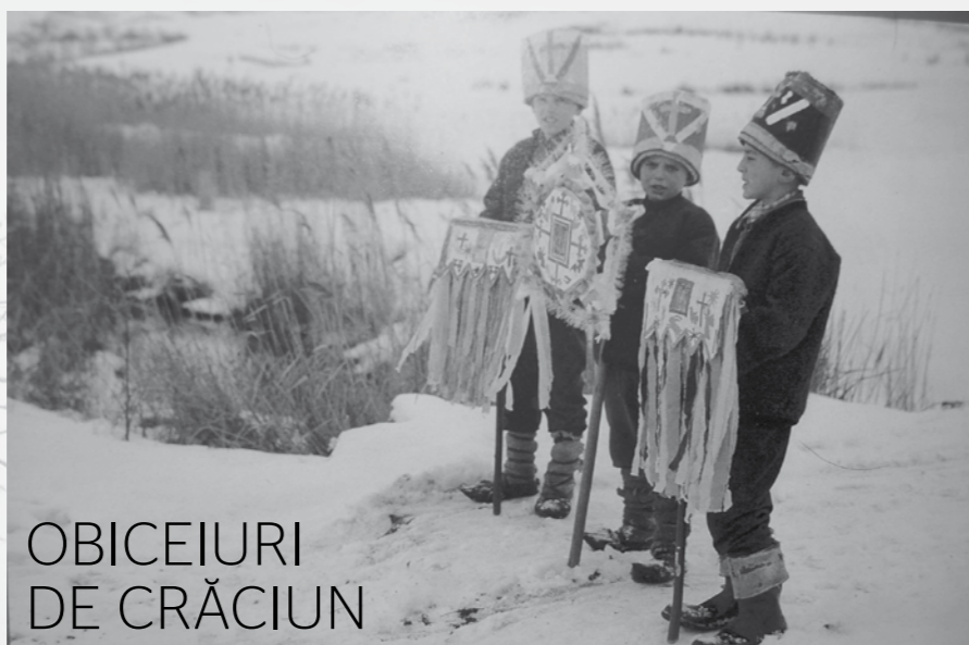
OBICEIURI DE CRĂCIUN

Sub raportul măiestriei artistice a versului și a melodiei, colindele ocupă un loc de seamă în creația poporului nostru. Ele formează un tot