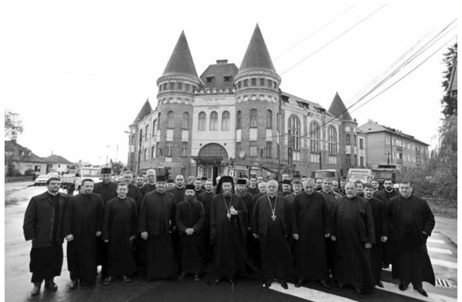
Palatul Episcopal din Sighetu Marmatei după retrocedare