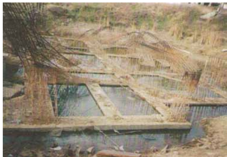
Șantierul Catedralei Episcopale - 1999