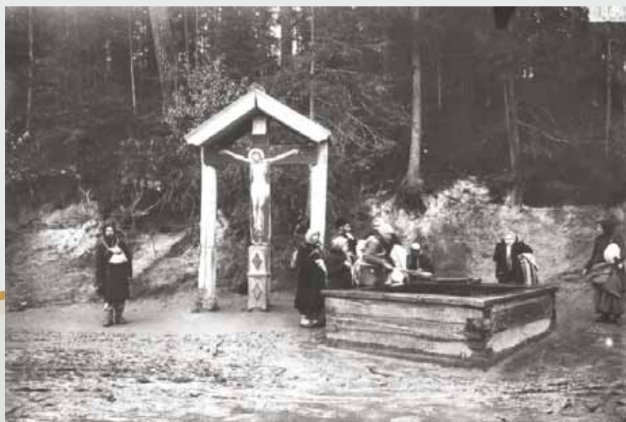
Sfintele moaște ale Sf. Serafim de Sarov au fost găsite la St. Petersburg, într-un depozit al unui muzeu, după anul 1990. Astăzi, Moaștele Sfântului Serafim se află la Diveevo (10 km de Sarov).

La puțină vreme după hirotonirea sa și după moartea duhovnicului său, el a primit încuviințarea de a se retrage în singurătate, în adâncul pădurii, la 6-7 km de mănăstire. Dar diavolul nu s-a dat bătut și a trimis trei tâlhari, care, furioși că n-au găsit la sârmanul monah banii la care sperau, l-au bătut cu ciomegele și cu dosul unui topor, lăsându-l pe jumătate mort, cu totul însângerat și cu oasele rupte. Cu toate că avea o constituție