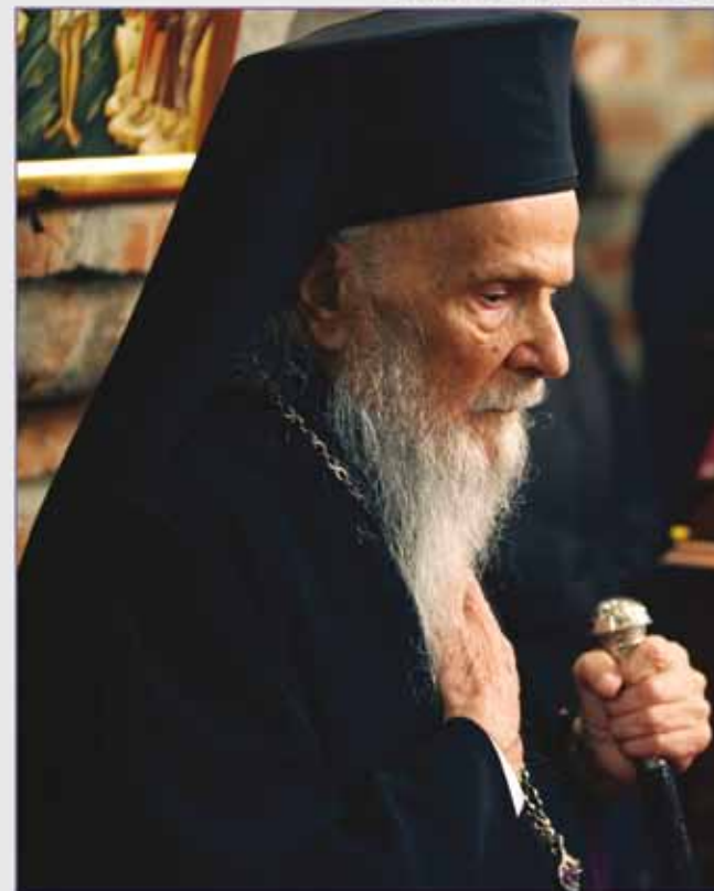
Ediție îngrijită de mircea crișan

lucruri de o mare valoare, gânduri ale unui mare Mărturisitor al lui Hristos, crâmpie din rugăciunile unui Sfânt menite să ne înalțe și să ne întărească, pasaje demne de un mare teolog, și chestiuni de detaliu și de finețe pe care o minte omenească nu le-ar putea așterne pe hârtie fără inspirația Duhului Sfânt. Și cu toate că sunt scrise cu mare har și sensibilitate, elementul care predomină este smerenia.