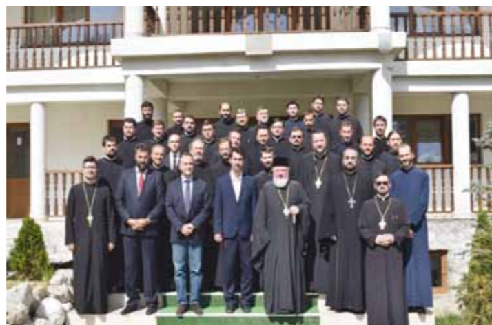
Responsabilii de catehizare din Patriarhia Română