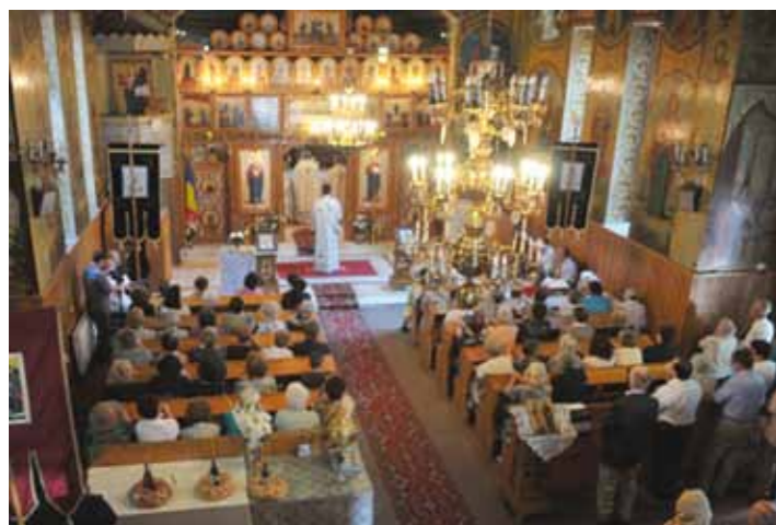
Biserica, în care s-au adunat credincioșii pentru a-i cinsti pe Sfinții Apostoli Petru și Pavel, a început să fie construită prin anul 1937-1938.