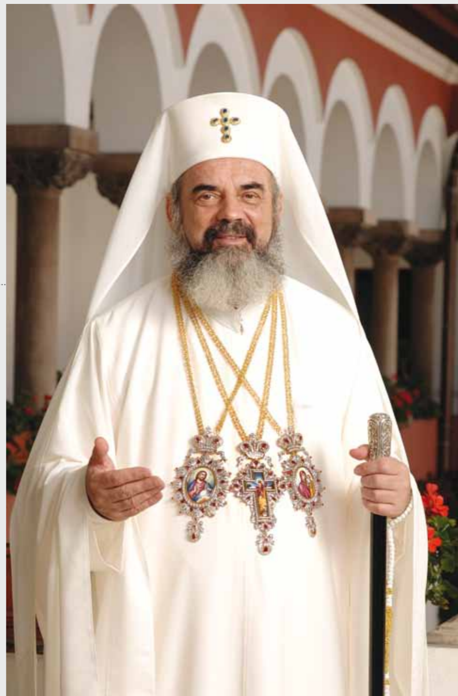
† DANIEL Patriarhul Bisericii Ortodoxe Române

2 Admirația lui Mihai Eminescu pentru frumusețile plaiurilor românești, pentru păduri și poieni, pentru tomnaticii „ codri de aramă ” și pentru pitoreștile „ păduri de argint ”, pentru munte și mare se îmbină cu admirația sa pentru frumusețea lunii și a stelelor, dar și cu pasiunea sa pentru înțelegerea filosofică a începutului timpului și spațiului, a universului fizic, a cosmosului, astfel încât unele dintre expresiile sale poetico-filosofice uimesc și azi prin profunzimea intuițiilor sale personale. Eminescu a preluat idei filosofice universale și le-a prelucrat artistic într-un mod creator admirabil.