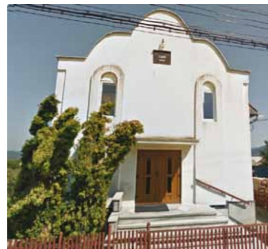
Biserica Penticostală Betel - Săsar

În comuna Recea predomină religia ortodoxă, fiind reprezentată de cinci lăcașuri de cult, câte una în fiecare localitate. Cultul Greco-catolic are câte o biserică în Mocira și Lăpușel. Tot în Lăpușel există o biserică reformată. De asemenea, cultul neoprotestant are un lăcaș de cult în Săsar.