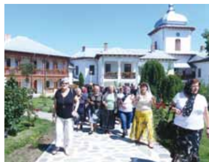
Pensionarii din Săsar în pelerinaj

În cadrul acestor asociații, bătrânii se întâlnesc, organizează excursii, pelerinaje, sărbătoresc împreună Revelionul, de exemplu, și alte manifestări.