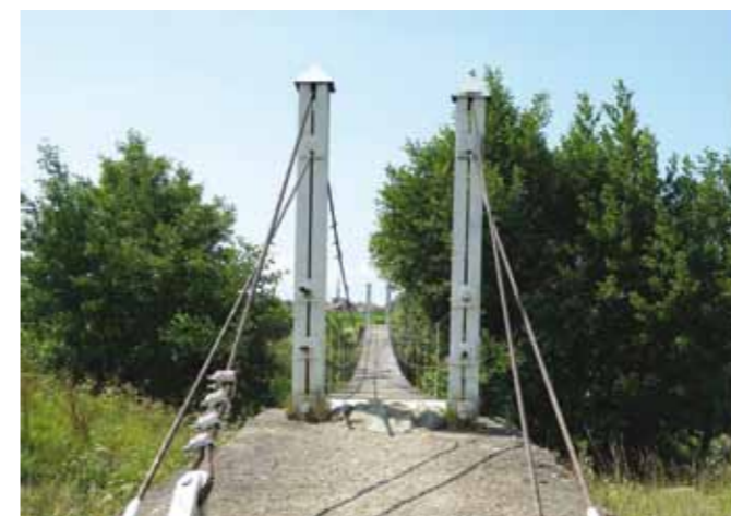
Punte peste râul Săsar

La acesta se adaugă proiectele realizate sau în curs de realizare a căror rezultate nu sunt deloc de neglijat. Primarul comunei Recea spune că: „Avem în curs de implementare extindere rețea de canalizare în localitatea Săsar, un