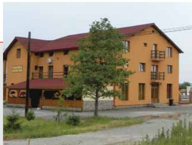
Pensiunea Golden Star din Lăpușel