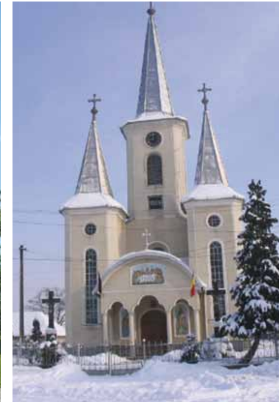
Biserica Ortodoxă Săsar

„În fiecare an facem câte o excursie în străinătate cu elevii merituoși din comună, preoți, consilieri, oameni de afaceri, pentru a uni comunitatea”.