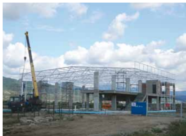
Sala de sport din Recea