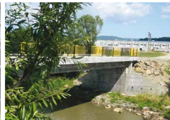
Podul peste râul Săsar