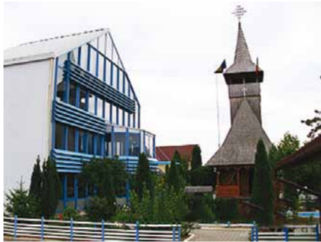
IMI S.A. din Mocira