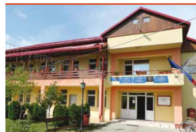
Sediul Primăriei Recea