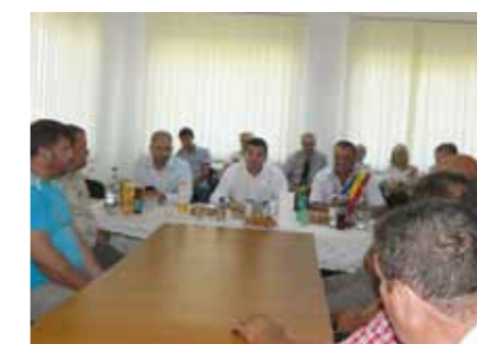
Ministrul Agriculturii, Daniel Constantin, de vorbă cu agricultorii din comuna Recea