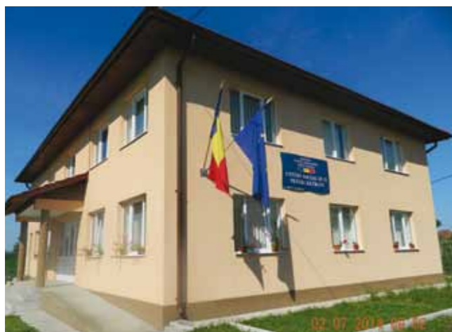
Centrul de zi