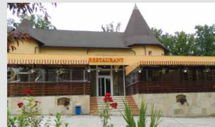
Hotel-Restaurant „Două veverițe”, Lăpușel