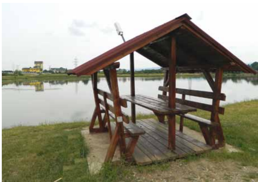
Amenajarea piscicolă „Două Veverițe”

Astfel, de importanță deosebită este societatea S.C. I.M.I. S.R.L., mare