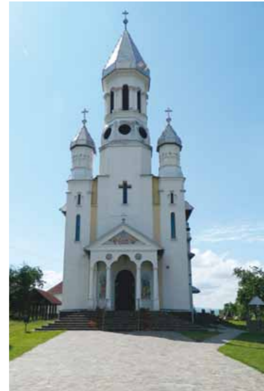
Biserica Ortodoxă Mocira