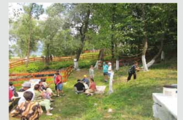
Parcul de agrement Stibina