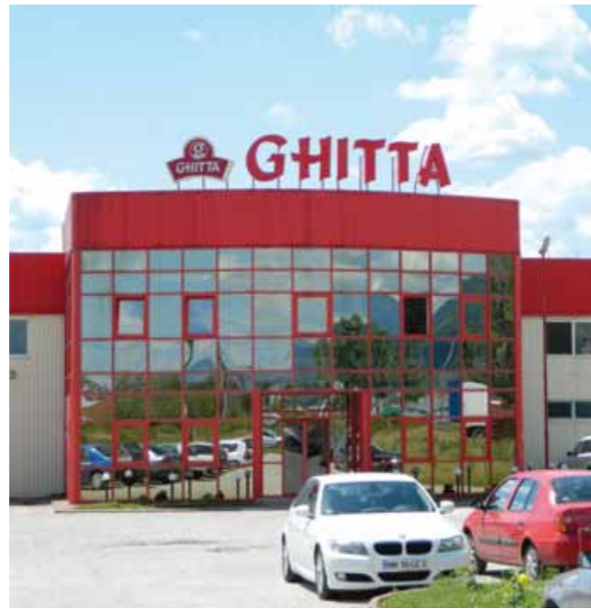
Ghitta - Recea