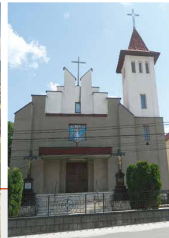
Biserica Greco-Catolică Lăpușel