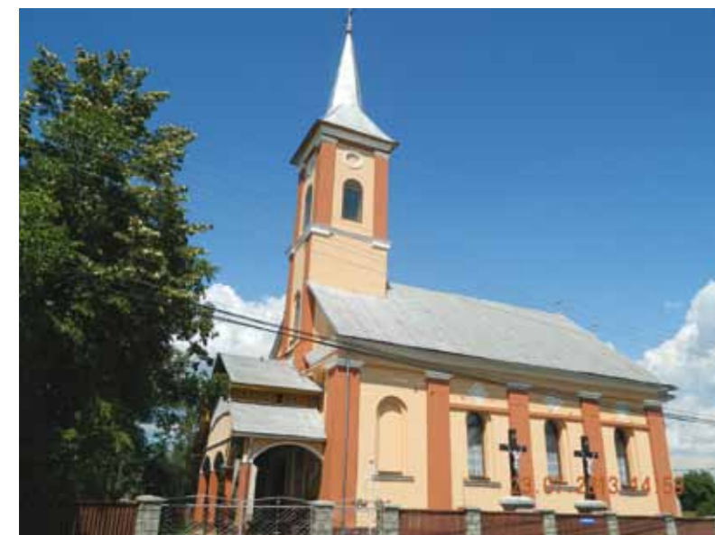
Biserica Ortodoxă Bozânta Mică