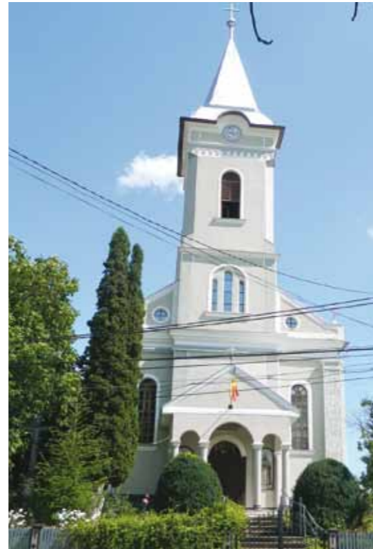
Biserica Ortodoxă Lăpușel