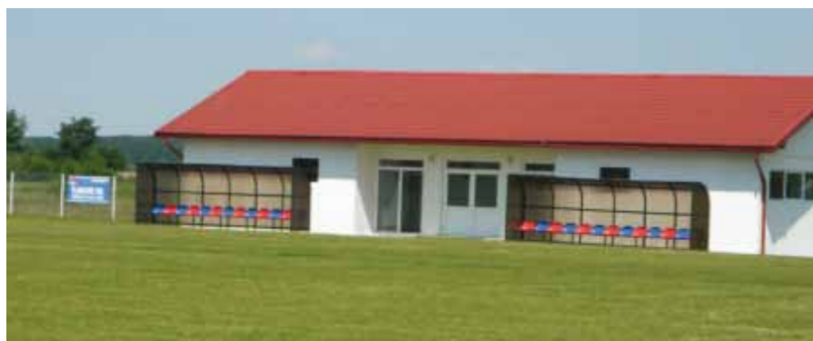
Baza sportivă din Săsar

Satul RECEA , atestat în anul 1828, când se numea LÉNARDFALU RÉCZ, iar în anul 1851 se numea LÉNARDFALU.