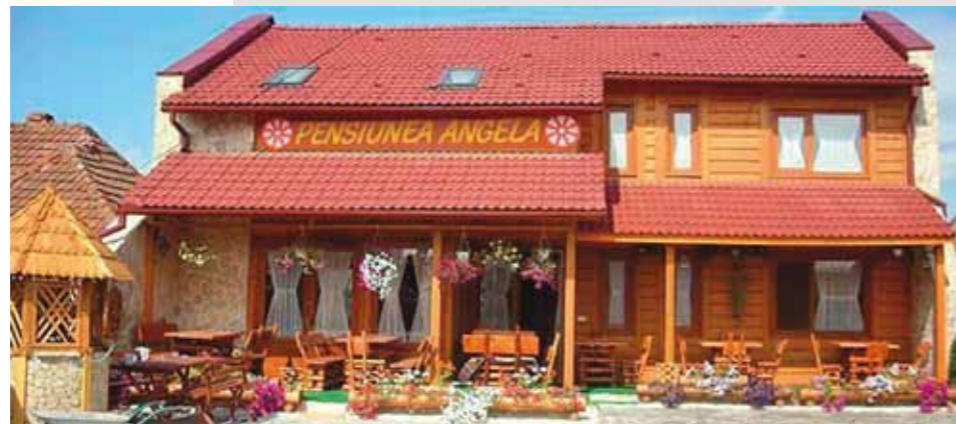
Pensiunea Angela - Recea