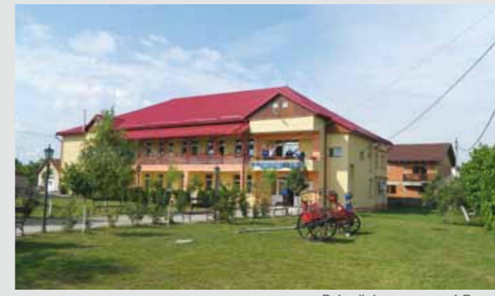
Primăria comunei Recea