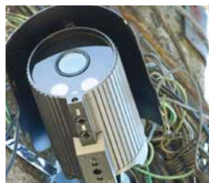
Sistem de monitorizare

Alt proiect de anvergură a fost alimentarea cu apă a localităților Lăpușel și Bozânta Mică, cu extindere pe Mocira și Recea, proiect pe care l-am dus la bun sfârșit. Am avut proiectul prin care am renovat toate unitățile de învățământ,