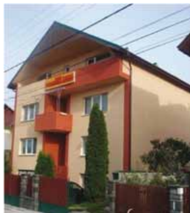
Pensiunea Daria - Săsar

Dacă tot vorbim de turism, cea mai importantă zonă de agrement este amenajarea piscicolă „Două Veverițe”, cu o suprafață de 6,4 ha, reprezentând, în luciul de apă, suprafața destinată pentru practicarea pescuitului sportiv, de către locuitorii comunei și alți pasionați. Așa că turismul local este axat în special pe vizitarea Lacului și cabanei „Două Veverițe”, amenajate și reconstruite în ultimul timp, fapt care atrage un număr însemnat de turiști.