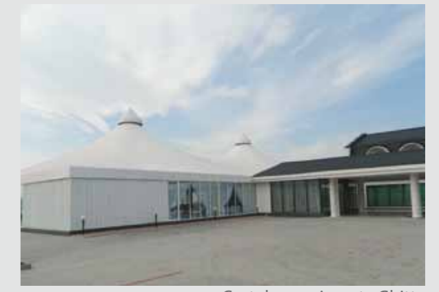
Cort de evenimente Ghitta