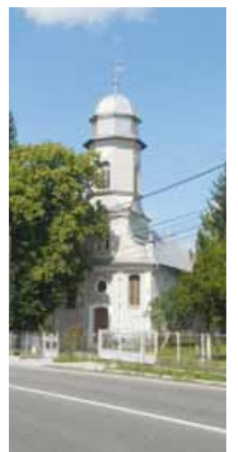
Biserica Reformată Lăpușel