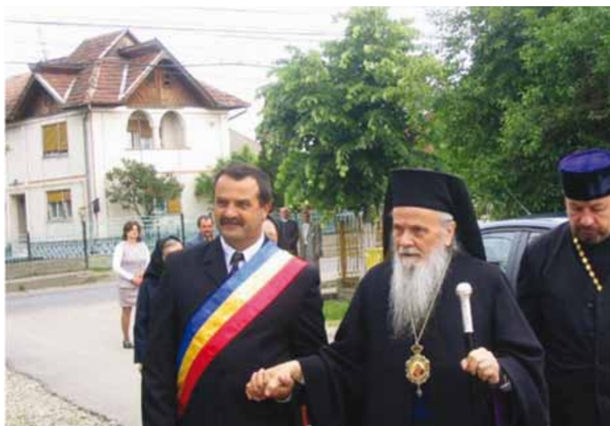
Vizită arhierescă a ÎPS Iustinian în Recea

Populația este foarte diversificată din punct de vedere al preocupărilor și activităților. La un număr de 5453 locuitori, 451 sunt elevi, 1600 sunt angajați ai unor societăți și întreprinderi, 1375 sunt pensionari, iar în agricultură și alte categorii se încadrează un număr de 2027 locuitori.