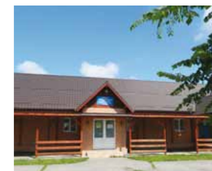
Cămin cultural Mocira