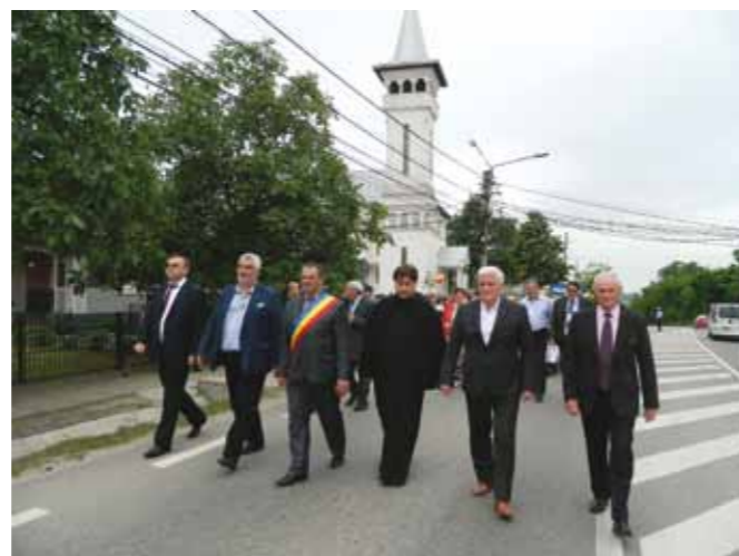
Festivalul „Mândru-i danțu’ pe la noi”