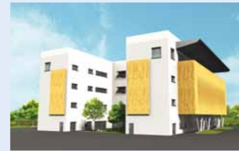
Campus de training și design

„Vorbind de partea de execuție, Departamentul nostru de Inginerie din UACE se ocupă de prelucrarea datelor tehnice, astfel încât să putem executa piesele care se vor monta pe avioane. Ceea ce se dorește să se facă la fabrica de la Tăuții Măgherauș în materie de proiectare este foarte important datorită faptului că pe lângă prelucrarea pieselor am putea să le și proiectăm în astfel încât să le executăm la costuri mult mai mici, cu o fiabilitate mai mare și un design mai performant.