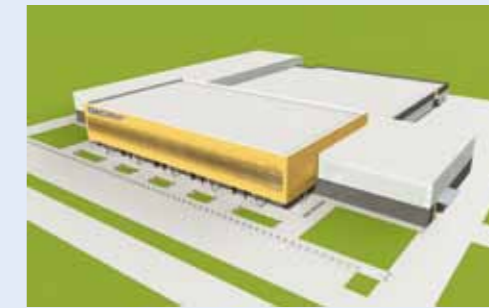
Hală producție componente aluminiu și titaniu