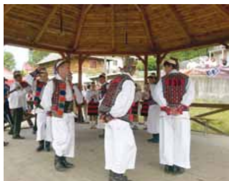
La Călinești a fost reînviat JOCU' LA ȘURĂ , care are loc în fiecare duminică.