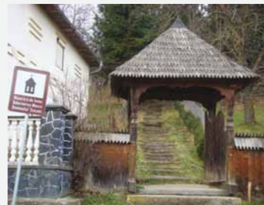
Biserica din Susani

De asemenea, bătrânele din zonă sunt dispuse să povestească turiștilor legende cu Fata Pădurii, Omul Noptii și strigoi. Mai mult, la intrarea în satul Cornești există un loc inedit, numit «Râpa înconjurată», unde se spune că noaptea se vedeau luminițe care pâlpaie. Bătrânele spun că ar fi fost spiritele unor oameni plecați în lumea cealaltă.