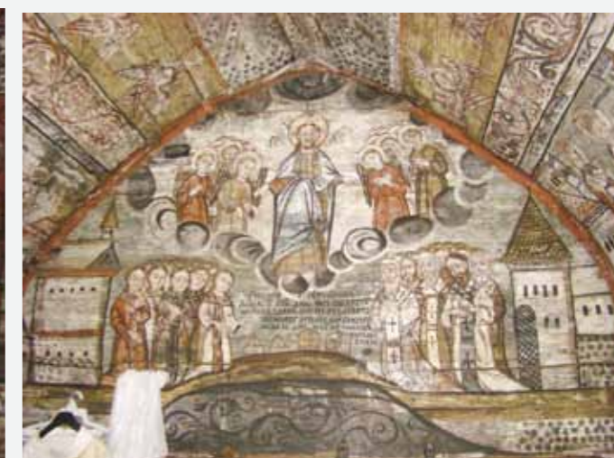
Biserica din Căieni, interior