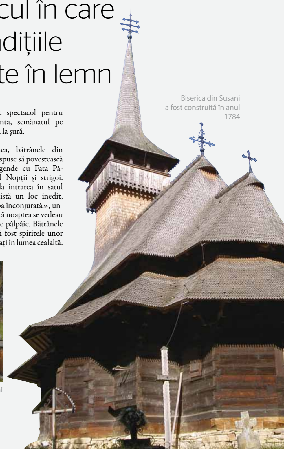
Biserica din Susani a fost construită în anul 1784