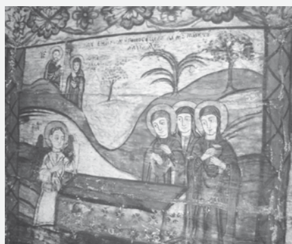
Pictură în Biserica din Căieni

Pe lângă ospitalitatea specific maramureșeană, porțile frumoase și tradițiile inedite, localnicii din Călinești se mândresc cu două biserici de o frumusețe aparte.