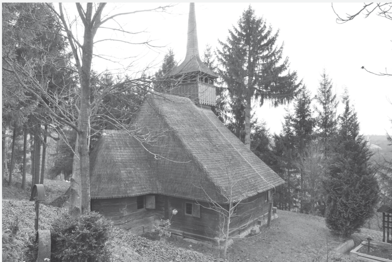
Biserica din Căieni