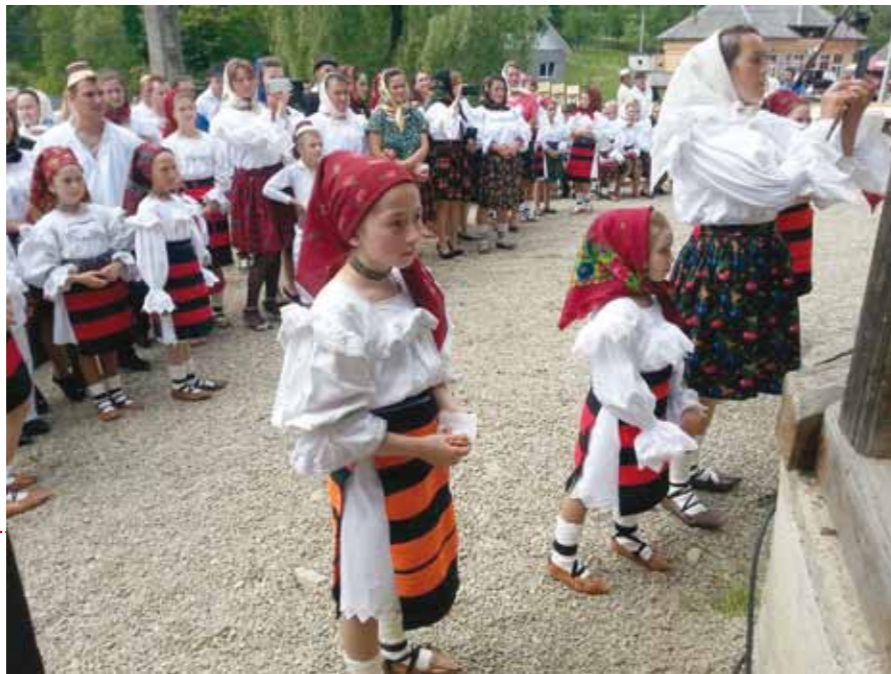
ÎNVÂRTITA VĂLENARILOR Este un eveniment realizat cu scopul păstrării tradițiilor și transmiterii către tânăra generație.

Comuna Călinești, o vatră cu bogate tradiții, un sat curat românesc, așezat între Iza și Cosău, este un loc unde s-au păstrat nealterate tradițiile și obiceiurile strămoșești, graiul și portul popular. Pentru ca acestea să dăinuie pe veci, au loc mai multe manifestări culturale deosebite.