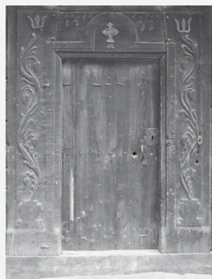
Portalul exterior al Bisericii din Susani

O altă bisericuță frumoasă este cea din «Susani», construită în 1784. Fundația bisericii este excepțională: planul triconc arată influența clară a Moldovei, unde acest tip e dominant. Într-un plan triconc sunt trei abside la capătul estic al bisericii, nu numai obișnuita absidă estică a altarului, ci și naosul cu două abside laterale, la nord și la sud. Accesul în biserică se face prin fațada sudică, nu prin cea vestică, cum este de obicei în cele mai multe biserici din Maramureș. Chenarul larg este decorat cu viță de vie, întoarsă pe piloni verticali, cu o cruce și data 1784 pe pragul ușii. Acoperișul are streșini duble în jurul bisericii și doar culmea altarului este ușor mai joasă decât principalul acoperiș. Pictura murală