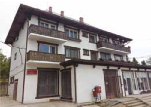
Bloc de locuințe Budești

Acolo funcționează grădinița și clasele I-IV, cu două clase de simultan. Știm că nu toată lumea este încântată, dar dacă am desființa școala, ne-am întoarce în timp. Pentru că, dacă ne detașăm de Școală și Biserică, pierdem tot ce avem sfânt și bun în sufletul nostru.