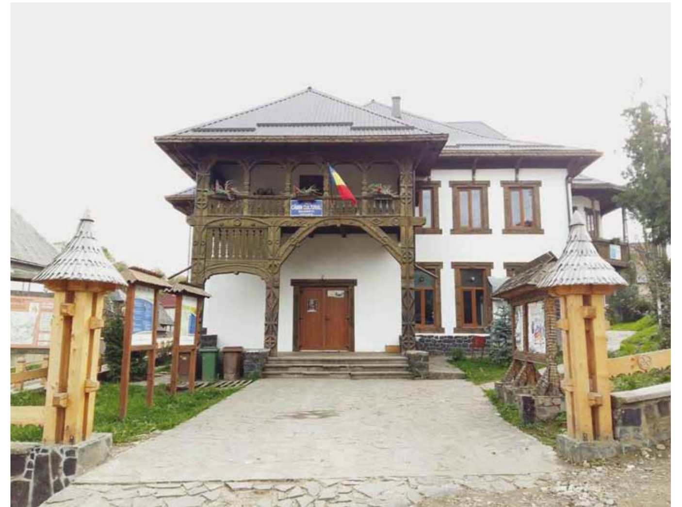
Căminul cultural Budești

toare este identitatea, cultura și tradițiile. Că acestea nu asigură doar dezvoltarea unei comunități ci, mai ales, dăinuirea ei peste timp. De aceea, a devenit primarul maramureșean care promovează cel mai mult cultura autentică și tradițiile locale în tot și în toate, inclusiv în proiectele de investiții.