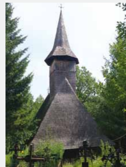
Biserica veche Sârbi

Patru dintre cele cinci Biserici existente în comună sunt Biserici construite din material lemnos: trei Biserici monument istoric, înscrise în patrimoniul național, o Biserică monument istoric UNESCO. Biserica „Sfântul Nicolae” Josani, construită în anul 1643, este Biserica monument UNESCO și este vizitată frecvent de diverși turiști din țară și străinătate, fiind amplasată lângă drumul județean, în chiar centrul comunei Budești. Tot în comuna Budești, dar în zona numită Susani, este o Biserică de lemn, care poartă același hram cu cea din Josani, respectiv Biserica „Sfântul Nicolae”. Aceasta este construită în anul 1586.