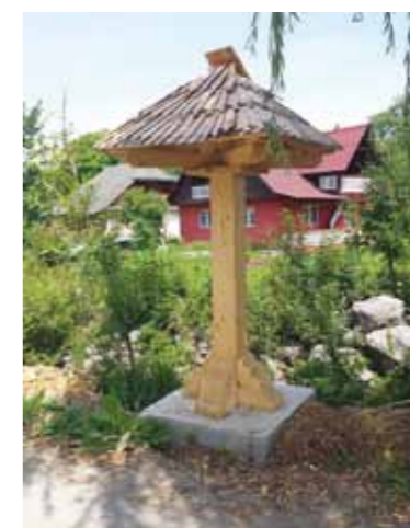
Afișaj meșteri populari

Există o bibliotecă, Biblioteca „Mihai Cupcea”, care a fost reabilitată și care deține 5500 volume de cărți. Instituția poartă numele „Mihai Cupcea” în memoria regretatului poet Mihai Cupcea, fiu al locului. În cadrul școlii din comuna Budești, pe lângă cele 8 săli de clasă existente, a sălii profesionale și a altor două birouri, există și un Muzeu Școlar, unde sunt expuse aproximativ 500 de obiecte și piese cu specific tradițional zonal. Prin existența acestui muzeu, dar și prin faptul că sunt localnici care se ocupă încă cu meșteșugurile specifice, tradiționale, se urmărește menținerea, promovarea, continuarea acestor îndeletniciri și implicit promovarea comunei ca și păstrătoare de tradiții și obiceiuri.