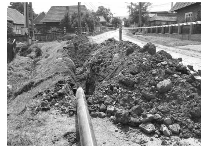
Alimentare cu apă în Budești

lucrurile se schimbă. Problema este că avem diferențe de nivel foarte mari și nu putem săpa la adâncime de doi metri, pentru că dăm de stâncă și piatră. Pe lângă acest aspect, casele sunt așezate pe deal atât partea de sus, cât și în partea de jos a uliței, este foarte greu să aducem canalizarea de jos până la uliță. La noi nu se poate face un proiect tip, iar costurile ar fi foarte mari inclusiv pentru execuție. Ca să putem face canalizarea, ar fi nevoie de peste 3 milioane de euro, iar asta înseamnă că ne trebuie 3 proiecte pentru că limita unui proiect este de un milion de euro. Dar, presupunând că obținem finanțarea, partea cea mai grea intervine la racordare, unde costurile de racordare și întreținere ar fi enorme, iar din această cauză am avea surpriza să nu fie folosită. Eu aș insista pe un sistem clasic de fose septice, dar finanțările europene nu acceptă fose septice. Însă, pe o motivare bine fundamentată și cu ajutor de la Guvern, poate reușim această variantă, cu canalizarea pe grupuri de case. Pentru că relieful nu ne permite altfel. Ne-am gândit să ne creem un serviciu de vidană pentru fosele septice, să achiziționăm o asemenea mașină și pe urmă să facem un