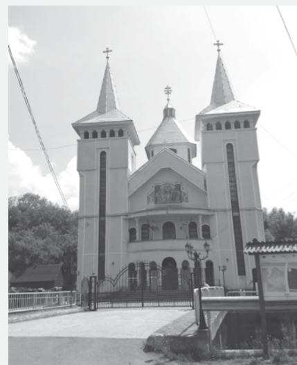
Biserica „Sfânta Treime” din comuna Budești, din cărămidă, ale căror lucrări de construire au început în anul 1990, se află încă în perioada de finisaje. Pentru aspectul ei actual s-au implicat 3 preoți, care au avut atât sprijinul localnicilor, cât și al autorităților publice locale.

S piritualitatea, credința și bisericile de lemn care își înalță turlele spre cer sunt cel mai reprezentativ simbol al dăinuirii unei comunități.