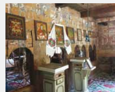
Biserica UNESCO Budești Interior

În comuna Budești viețuiesc în bună armonie credincioși ai diferitelor culte creștine, majoritari, în proporție de peste 95% fiind ortodocși.