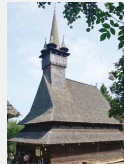
Biserica UNESCO Budești

„Mănăstirea Sfinții Constantin și Elena” a fost construită începând cu anul 1994, din material lemnos, având același specific ca și al celorlalte Biserici din lemn din comună. Aceasta se află în comuna Budești, în locul numit Roșia.