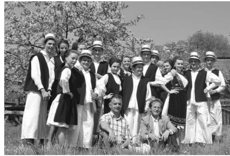
Colectivul Ansamblului Folcloric Dor Călător din Baia Sprie