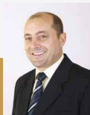
Consiliul Județean - 25 de ani

Cu prilejul aniversării a 25 de ani de la înființarea Consiliului Județean Maramureș, perioadă în care administrația județeană a fost alături de instituțiile și cetățenii județului, îi felicit pe toți angajații și conducerea Consiliului Județean, așteptând totodată noi proiecte de dezvoltare pozitive ale județului.