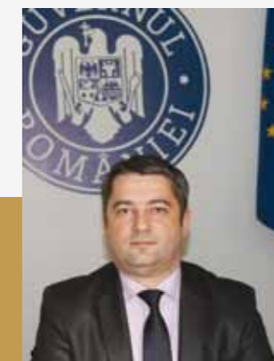
Bogdan Pușcaș Președinte al Agenției Naționale pentru Achiziții Publice

Ca mândru maramureșean, vă doresc un sincer „La mulți ani!”, multă putere de muncă și înțelepciune să creșteți notorietatea Maramureșului prin fapte demne de urmat!