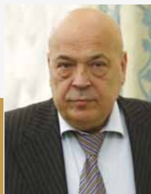
Mesaj din partea Regiunii Transcarpatia (Ucraina)

De foarte mulți ani, regiunea Transcarpatia (Ucraina) și județul Maramureș sunt legate de relațiile bună vecinătate. În primul rând, cooperarea transfrontalieră în cadrul căreia se realizează în comun multe inițiative economice, se consolidează dezvoltarea durabilă a comunităților noastre, se întăresc relațiile de colaborare între instituțiile de cultură și educație, dar mai ales se consolidează relațiile între cetățenii comunităților noastre.