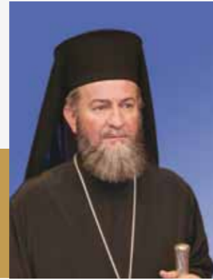
† PS Iustin , Episcopul ortodox al Maramureșului și Sătmărușului

La ceas aniversar, dorim Instituției Consiliului Județean, Președintelui și Consilierilor o bogată și îndelungată activitate în slujba maramureșenilor, nutrind totodată speranța unei bune și fructuoase colaborări.