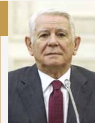
Teodor Meleșcanu, Ministrul Afacerilor Externe

Doresc, în primul rând, să adresez mulțumiri pentru buna cooperare prilejuită de celebrarea Zilei Naționale a României în 2016. Vechi leagăn de cultură și civilizație românească, Maramureșul reprezintă pentru mine un loc special în care se conservă și se promovează cu mândrie valorile proprii. Îmi exprim convingerea că originalitatea tradițiilor locale și portul popular maramureșean vor continua să fie activ promovate astfel încât să fie cunoscute și apreciate de cât mai multă lume pe întreg mapamondul.