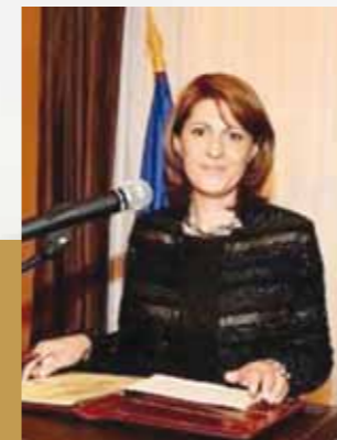
Gabriela Dancău, Ambasadorul Extraordinar și Plenipotențiar al României în Regatul Spaniei

Doresc, în primul rând, să adresez mulțumiri pentru buna cooperare prilejuită de celebrarea Zilei Naționale a României în 2016. Vechi leagăn de cultură și civilizație românească, Maramureșul reprezintă pentru mine un loc special în care se conservă și se promovează cu mândrie valorile proprii. Îmi exprim convingerea că originalitatea tradițiilor locale și portul popular maramureșean vor continua să fie activ promovate astfel încât să fie cunoscute și apreciate de cât mai multă lume pe întreg mapamondul.