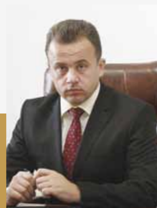
Liviu Marian Pop, Ministrul Educației Naționale

Să ne revedem și peste 25 de ani, la fel de hotărâți să facem fapte bune și să adoptăm doar decizii înțelepte!