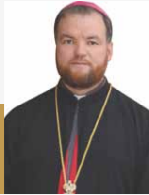
† Vasile Episcop greco-catolic de Maramureș