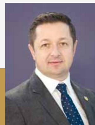
Marius-Alexandru DUNCA, Ministrul Tineretului și Sportului