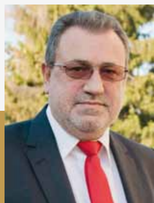
Gheorghe Șimon, Ministrul Economiei

Au trecut 25 de ani de la înființarea Consiliului Județean Maramureș, 25 de ani care ascund în spate foarte multă muncă, foarte multe proiecte, extrem de multe decizii și hotărâri bune sau mai puțin bune. Sunt 25 de ani în care, în acest Consiliu Județean au fost reprezentanți din nenumărate partide, multe din ele nemaexistând astăzi decât în analele politicii. Consiliul Județean este însă tot aici, mai puternic, mai important și acum vorbim despre o instituție extrem de vitală județului Maramureș, unde se iau cele mai importante decizii.