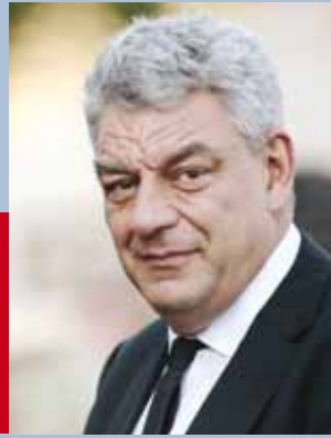
Mihai Tudose, Prim-ministrul României

La mulți ani maramureșenilor! La mulți ani Consiliului Județean Maramureș!