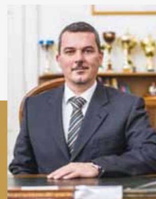
Sándor Kovács, Președintele Adunării Generale a județului Jász-Nagykun- Szolnok

Parteneriatul nostru cu județul Maramureș este unul dintre cele mai vechi dintre toate relațiile noastre de înfrățire. Stabilindu-se în anul 1993, această relație de prietenie sărbătorește deja 25 de ani. Colaborarea noastră a fost intensă în mod special în ultimii 13 ani, după cum o arată proiectele comune implementate cu succes în domeniul turismului, culturii, protecției mediului.