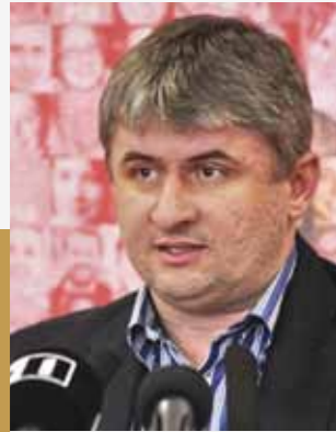
Dragoș Titea, Secretar de Stat în Ministerul Transporturilor

Maramureșul marchează un moment aniversar dedicat unei comunități puternice, o comunitate care, în 25 de ani, și-a păstrat și apărât „țările” Maramureșului și valorile locului, cu sprijinul celor care în acest sfert de secol, au contribuit prin eforturile și preocupările lor la dezvoltarea acestui județ. Îmi exprim recunoștința față de toți cei care au condus Consiliul Județean și salut inițiativa actuali conduceri executive de a marca acest moment important pentru administrația județului.