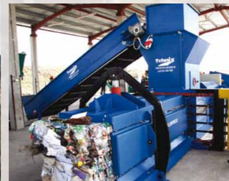
Stație de sortare