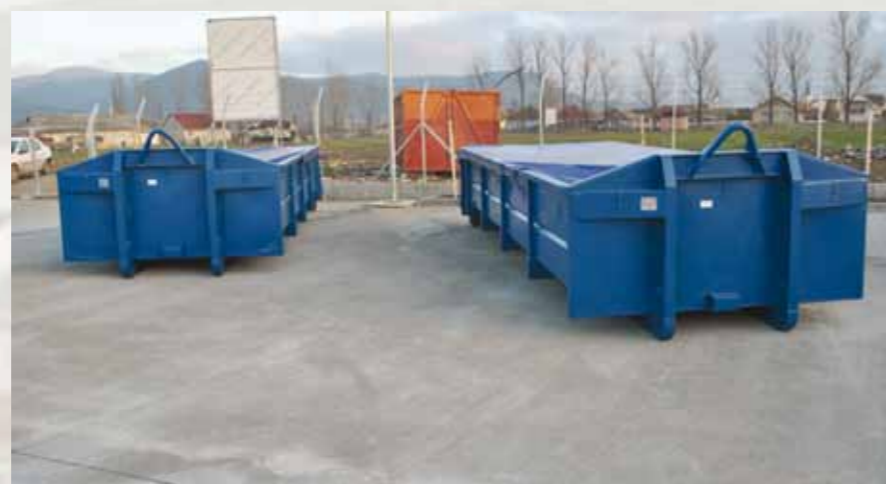
Centrele de colectare a deșeurilor voluminoase, Seini, decembrie 2015