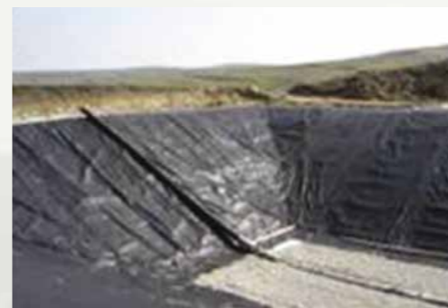
Tehnologii realizate/depozit ecologic