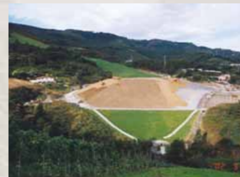
Depozite de deșeurii neconforme închise