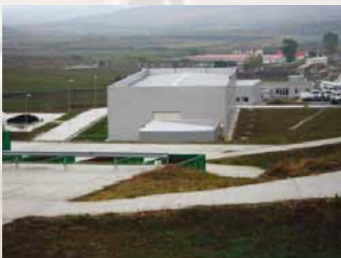
Un centru similar din Dumitra, județul Bistrița-Năsăud