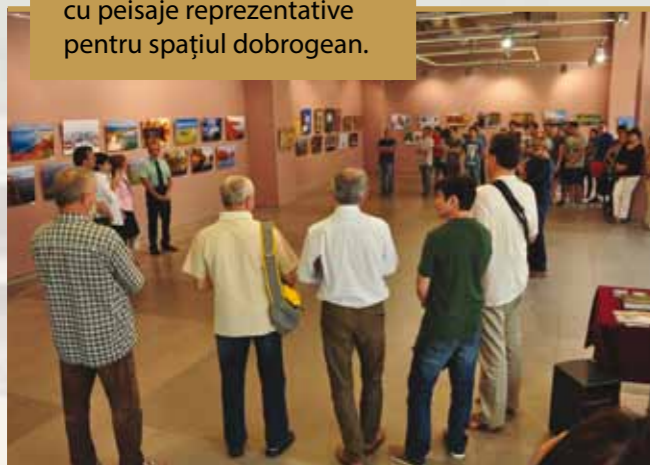
Vernisaj Dunărea, Dobrogea, Delta

În perioada iulie – august 2016, în colaborare cu Centrul Muzeal Ecoturist Delta Dunării, a fost organizată expoziția temporară „Dunărea, Dobrogea, Delta”, o expoziție de fotografie cu peisaje reprezentative pentru spațiul dobrogean.