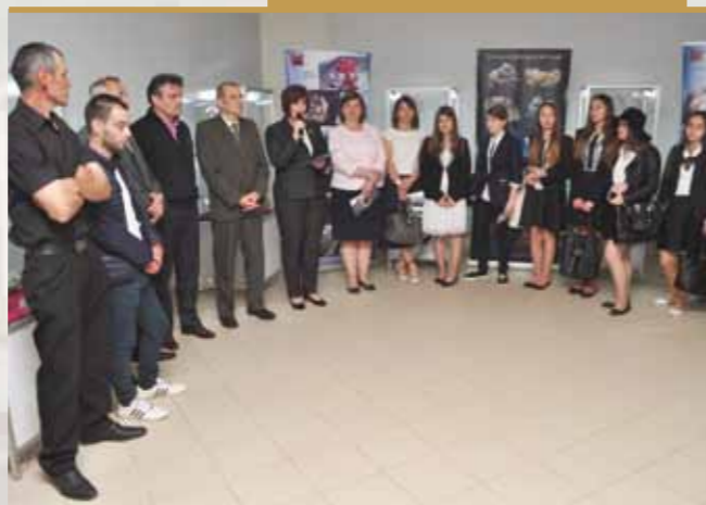
Vernisaj Negrești Oaș

În privința expozițiilor cu tematică mineralogică organizate de Muzeul de Mineralogie în România, acestea au fost două la număr și ambele au reprezentat premiere expoziționale, fiind organizate în Negrești-Oaș și la Giurgiu, locații în care Muzeul nu a mai fost prezent în trecut.