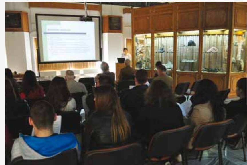
Simpozion „Patrimoniul natural al Transilvaniei”

Maramureș, România” este cea de-a 10-a expoziție organizată în Ungaria și a fost realizată în colaborare cu Muzeul Janus Pannonius din localitatea Pecs.