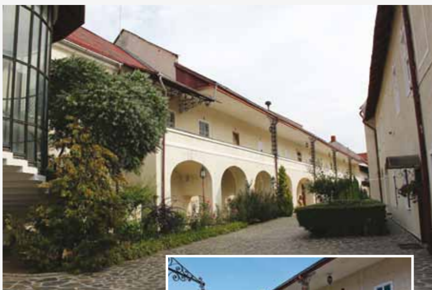
Curtea interioară a muzeului

Muzeul Județean de Istorie și Arheologie Maramureș este o instituție publică de cultură aflată în subordinea Consiliului Județean Maramureș, care asigură resursele financiare necesare realizării obiectivelor rezultate din funcțiile de bază ale muzeului.