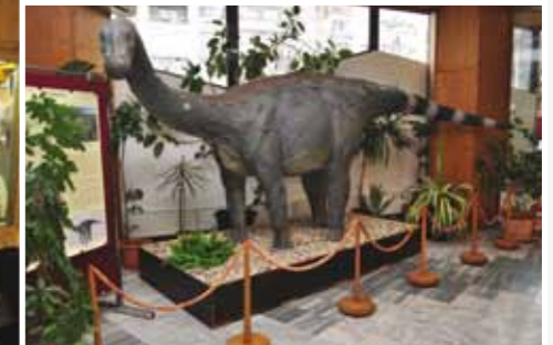
Expoziția temporară „Ultimii dinozauri din Transilvania”

de organizatorii Mineral Munich Show, unul în anuarul Muzeului Maramureșean și un articol aniversar în Revista Muzeelor.