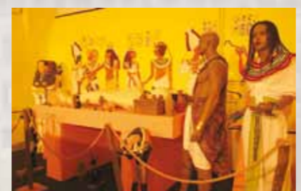
Mari Civilizații ale Antichității

Mineritul a constituit mult timp baza economică a zonei Baia Mare, patrimoniul muzeal care face posibilă reconstituirea evoluției sale cuprinzând aproximativ 1500 piese. Unelte, mijloace de transport ale minereului,