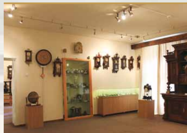
Călătorie în universul Ceasului

Bunurile culturale mobile care alcătuiesc patrimoniul muzeului provin