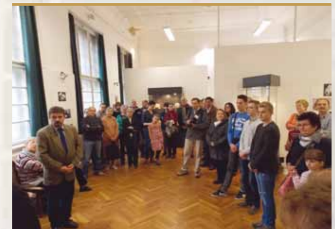
Vernisaj Pecs Ungaria

Pentru a marca într-un mod potrivit un an atât de plin de evenimente, de noutăți și de împliniri, ultima manifestare organizată de Muzeu a fost reprezentată de „Povești de Crăciun” - un dublu eveniment ce a cuprins o prezentare detaliată a Republicii Chile și un splendid concert de colinde oferit de Corala Armonia.