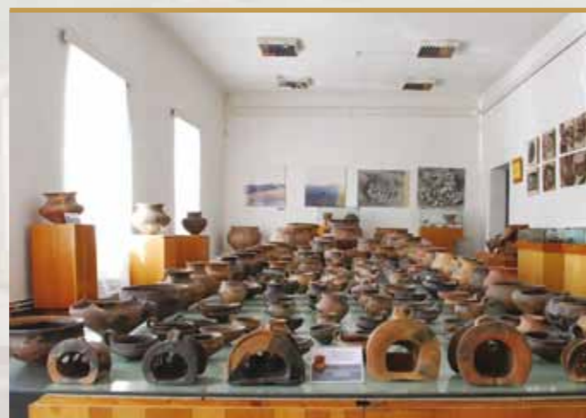
Comori ale Epocii Bronzului din nordul Transilvaniei 1 (2)