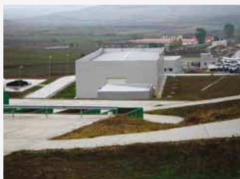
Un centru similar din Dumitra, județul Bistrița Năsăud