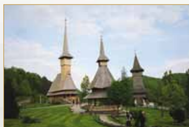
Proiectul „Circuitul bisericilor de lemn”