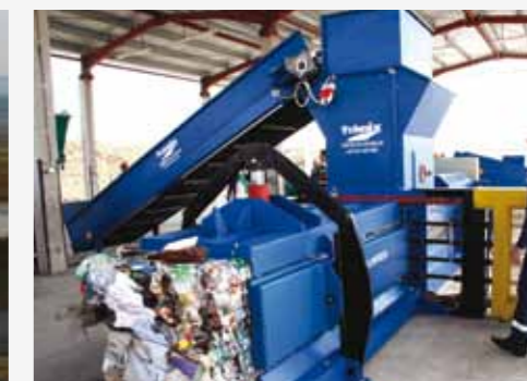
Stație de sortare