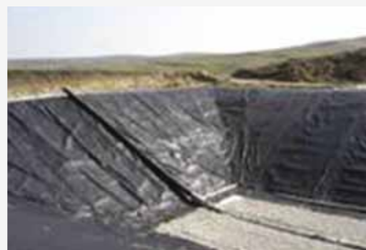
Tehnologii realizate/depozit ecologic

îngrijorați de prețurile viitoare, alții, cum e cazul orașelor Ulmeni și Târgu Lăpuș, și-au înființat și dotat prin proiecte europene servicii proprii de salubritate și, în fine, alții nu vor să renunțe la „robinetul de resurse” numit colectarea deșeurilor.