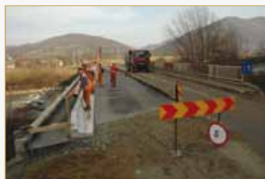
Reabilitarea drumului Baia Sprie-Bârsana