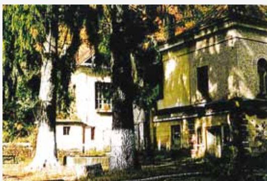
Fațadele vest și sud - parțial