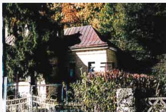
Fațadele est și sud - parțial