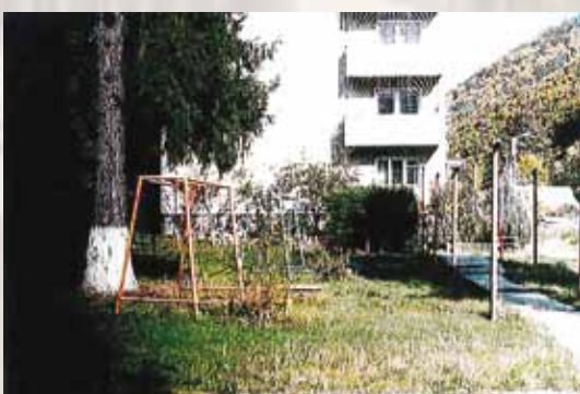
Bloc de locuințe. Fațada spre incinta castelului

are o suprafață de 72 m 2 și 2 încăperi; ■ Clădirea centralei termice, are 1 nivel parter având o suprafață de 110 m 2 și 3 încăperi.