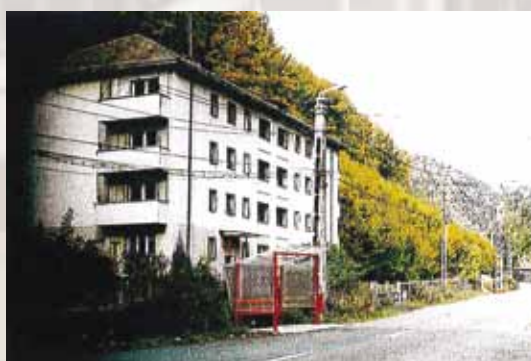
Bloc de locuințe. Fațada spre stradă

Consiliul Județean Maramureș deține mai multe imobile în patrimoniul său, printre care și Castelul Pocol , situat în Baia Mare, strada Valea Borcutului nr. 119, aflat pe lista obiectivelor de patrimoniu național, categoria B (cod LMI 2004 : MM II-m-B-04491), imobil care în prezent nu este utilizat și se află într-o stare avansată de degradare.