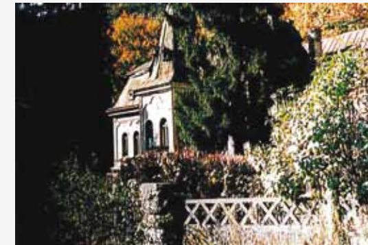
Detalii castel. Fațada sud - parțial