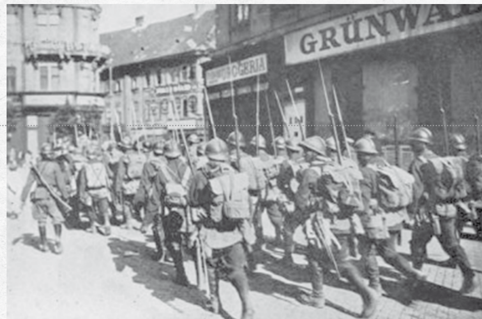
Armata română intră în Budapesta

Relevant pentru modul de gândire al generalilor români arestați este și memoriul trimis din închisoare ministrului de Război de către generalul Constantin Voiculescu, fost guvernator al Basarabiei, prin care informa că în dimineața zilei de 12 octombrie 1944 fusese arestat din ordinul Consiliului de