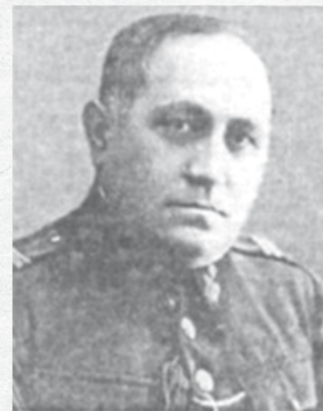
Gen. Constantin Voiculescu