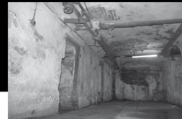
"Zarca" - carceră, în închisoarea Aiud, ce nu avea ferestre, unde deținuții erau lăsați, timp de o lună, fără paturi și fără haine groase pe timp de iarnă.