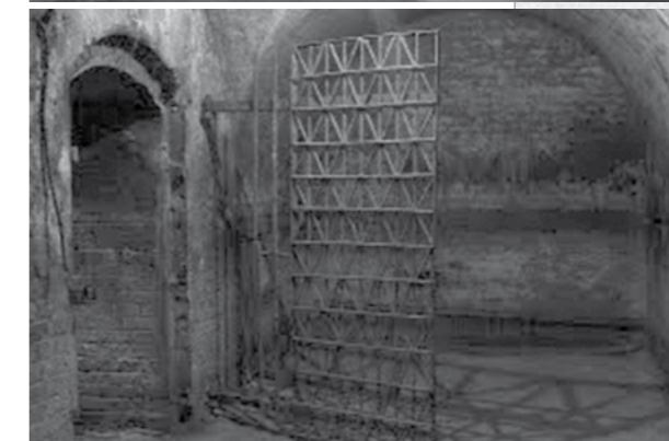
"Camera neagră" - o încăpere subterană din închisoare Jilava, unde deținuții erau ținuți 48 de ore, în întuneric, într-o baltă adâncă de câțiva centimetri, la o temperatură de cel mult două grade sub zero.