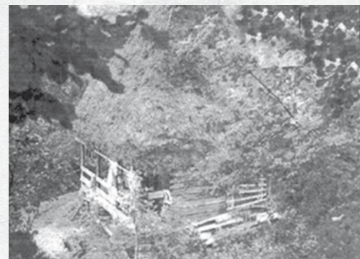
Casă construită în munte de grupul lui Leon Șușman