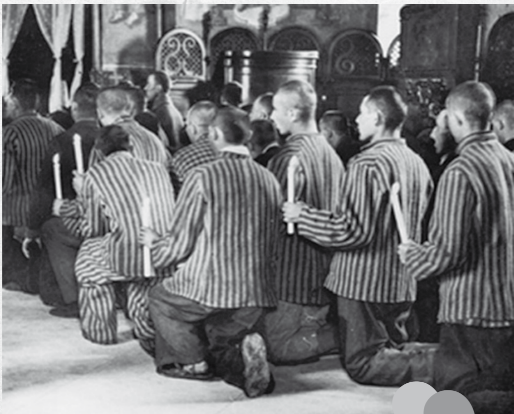
Dacă am săvârșit vreodată Sfânta Liturghie, a fost atunci. Acelea erau zile de sacrificiu și jertfă, extraordinare și unice.

Personal, nu am mai simțit durerea. Eram în propriul domeniu mai fericit decât atunci când eram afară liber, în lume.