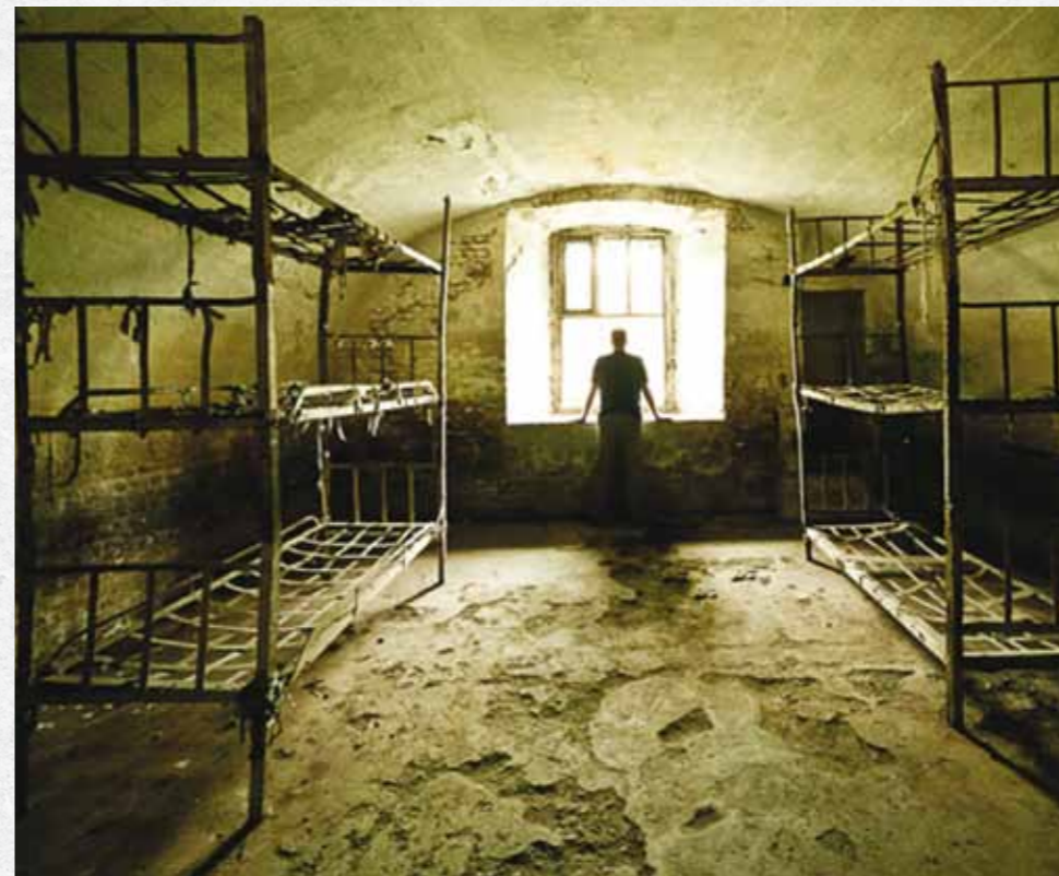
Erau incredibile discuțiile pe care le purtau. De la Nae Ionescu am învățat primele lucruri de filosofie și de la Blaga. Dar pentru filosofia de catedră, Steinhardt, nea Petrance Țuțea, Vulcănescu, era dezbateră de seminar, confruntarea intelectuală.

chinezesc cu niște munți foarte frumoși. A fost un vis colorat. Atunci, în Casimca Jilavei, mi-am spus ce răsplată mi-a dat Dumnezeu, o bucurie să văd lucruri așa frumoase. După 5 ani mă pomenesc liber. Au mai trecut 4 ani și ajung să fac un voiaj în China prin Uniunea Scriitorilor. Și în sudul Chinei, când am ieșit dintr-o vale, m-am pomenit în fața unui peisaj care era exact peisajul pe care-l visasem în Jilava. Nu uit nici acum cum era stânca. Tot atunci, când eram pe punctul să mor m-am visat în fața altarului bunicului meu și din altar a ieșit o mână care mi-a aprins lumânarea pe care o aveam în mână. Până atunci Ghiță zicea: măi nu muri dimineața, că nu-i bine să mori dimineața. După-masa îmi zicea: măi, dacă ai răbdat, nu-i bine să mori după-masa, mai rabdă până deseară. Seara zicea: măi, să știi că dacă mori, noaptea e foarte rău! A doua zi dimineața a zis: „acum nu mai știu ce să zic”. Iar eu doar am clipit din ochi și m-am gândit: nu mai zi nimic pentru că am avut un vis. De după